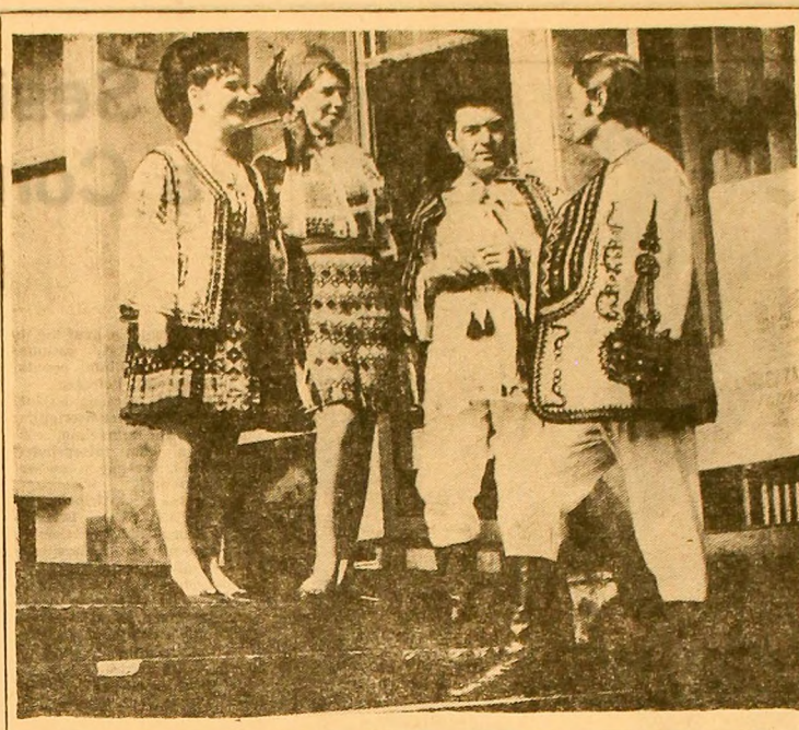
Pasiune. Un grup sonor și un număr de scene grafice care ascund în spatele lor un maldar de emoții...