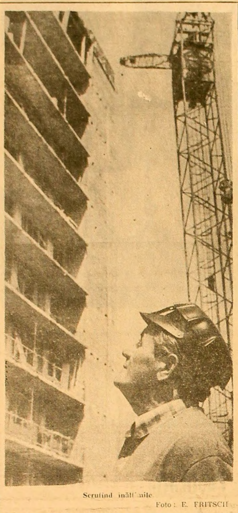
Scrutînd înălțimile.