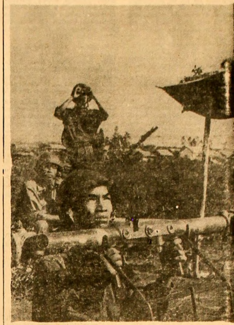
R. D. VIETNAM: De cînd la sfîrșitul lunii decembrie 1971 avioane ale armatei americane au bombardat teritoriul R. D. Vietnam, ostașii armatei populare vietnameze, ca și milita populară sînt continuați să dea ripostă cuvenită inamicului. În foto: Unitate aerieneră în provincia Quang Binh. Compania a doborât în cursul anului trecut 44 de avioane americane.

OSLO 21 (Agerpres). — La Oslo a avut loc o demonstrație de protest împotriva aderării Norvegiei la Piața comună.