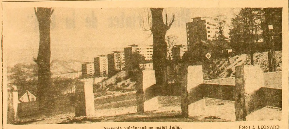
Secvență vulcănească pe malul Jului.