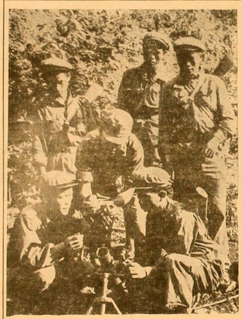
LAOS. În foto: Membri ai Armatei de Eliberare a Poporului Laotian făcând schimb de experiență în mișcarea muntierilor, în sectorul militar al văii Jars — Xieng Khoang.

Programul noului guvern ministerial, formată săptămânii trecută, a fost prezentat marți, de premierul Eyskens, celor două camere ale parlamentului. Declarația guvernului este axată pe relansarea economiei, precum și pe descentralizarea și întărirea unui control înmănușat al puterilor publice asupra activității economice. La dezbateri au participat 65 de deputați.