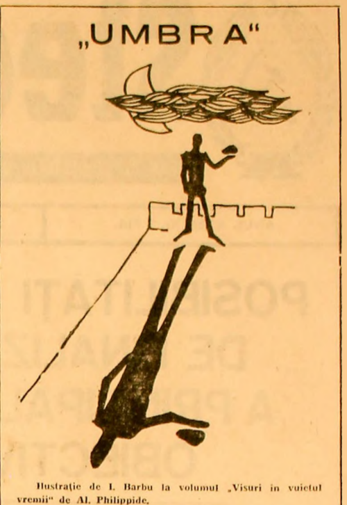
Ilustrație de I. Barbu la volumul „Vistiri în viciul vremii” de Al. Philippide.