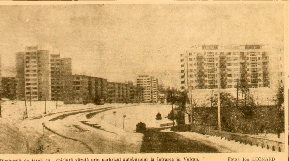
Dimineața de iarnă cu... chiciură vîntul prin parbrizul autobuzului la intrarea în Vulcan.