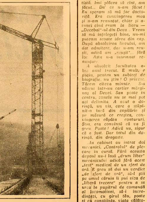
Crepuscul de iarnă la poligonul de prefabricate Livezeni.