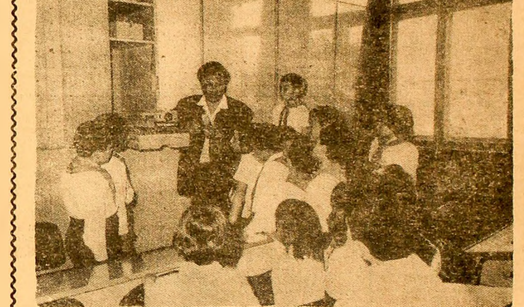
R.P. BULGARIA. La școala primară „Kosta Zlatarev” din Plevna se experimentează o nouă metodă de învățământ...

Planul cincinal de dezvoltare a economiei naționale a Uniunii Sovietice prevede să se mărească producția capacităților de prelucrare a fierului din U.R.S.S. de 1,5 ori.