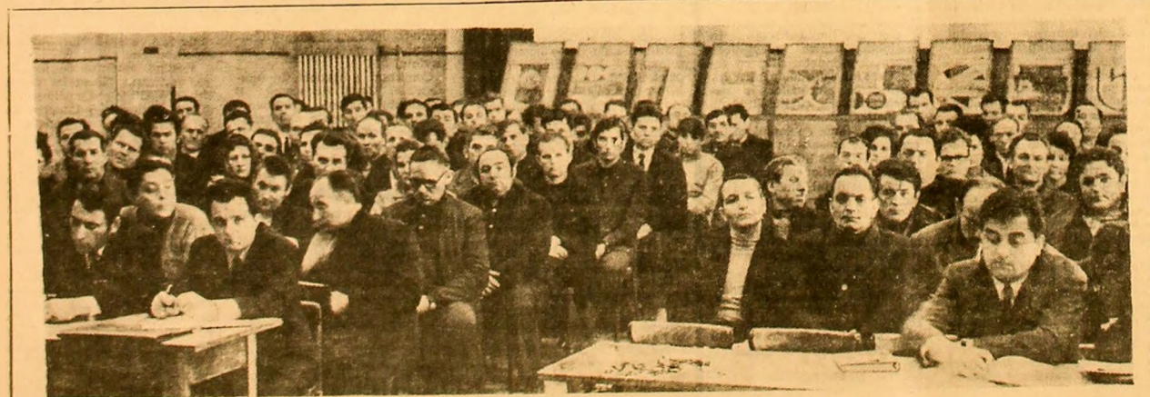
Dezbateri în plenul forumului muncitoreesc.

Comitetul sindicatului de la E.M. Dîlța, a inițiat organizarea unui schimb de experiență la abatoajele frontale de la minele din Valea Jiului. La această acțiune, vor participa toți angajații de la vintorele abatoaj frontale din cadrul exploatarea, constituind un important mijloc pe linia perfecționării profesionale.