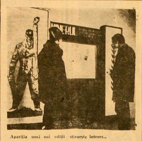
Apariția unei noi editii stineste interes...