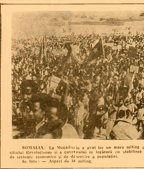
SOMALIA: La Mogadiscio a avut loc un mare miting pentru sprijinirea hotărîrii Consiliului Revoluționar și a guvernului în legătură cu stabilirea controlului de stat într-o serie de sectoare economice și de deservire a populației.

torul de stat a 91 de companii, procesul de naționalizare a monopolurilor în Chile va continua. În acest sens, el a anunțat că 130-140 de firme vor deveni proprietate de stat, sector care va avea în economie o pondere de 60 la sută. Totodată, va continua procesul de recuperare a pămînturilor în favoarea țărănimii, expropriindu-se numai în cursul acestui an 1.700 de latifundii.