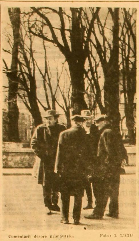
Comentarii despre primăvara...