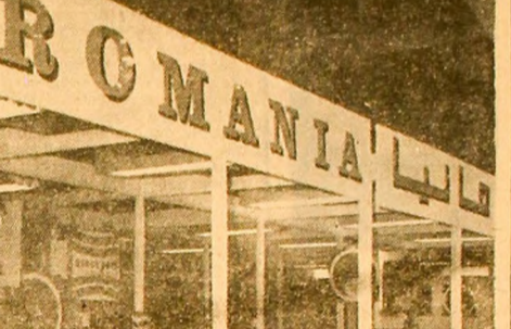
REPUBLICA ARABIA EGIPȚI: La 2 martie a fost deschis la Cairo, Festivalul Internațional, alături de care a avut loc și expoziția generală de mărfuri pe o suprafață de aproximativ 800 m 2 . În foto: Vedere parțială a pavilionului românesc din cadrul Târgului Internațional de la Cairo.

BRUXELLES 20 (Agerpres). — În perioada 10-19 martie a.c., la Bruxelles a avut loc a 25-a ediție a Salonului internațional de invenții și produse noi, manifestare la care au participat și un număr de întreprinderi românești. Invenții românești au fost prezentate la salonul internațional de invenții și produse noi, manifestare la care au participat și un număr de întreprinderi românești. Invenții românești au fost prezentate la salonul internațional de invenții și produse noi, manifestare la care au participat și un număr de întreprinderi românești.