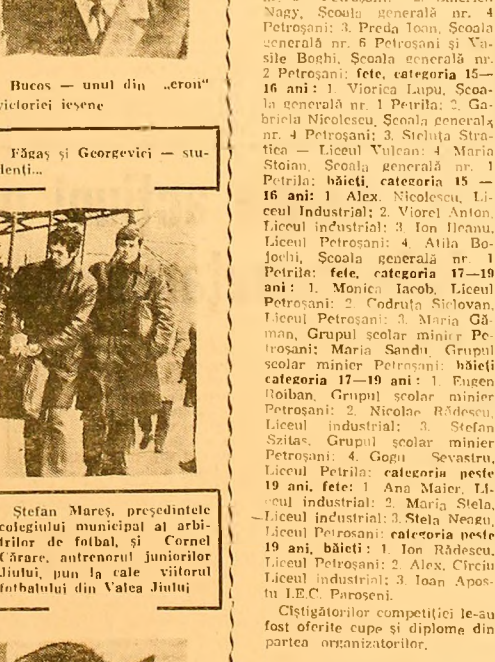
Bucos — unul din „eroii” victoriei ieșene