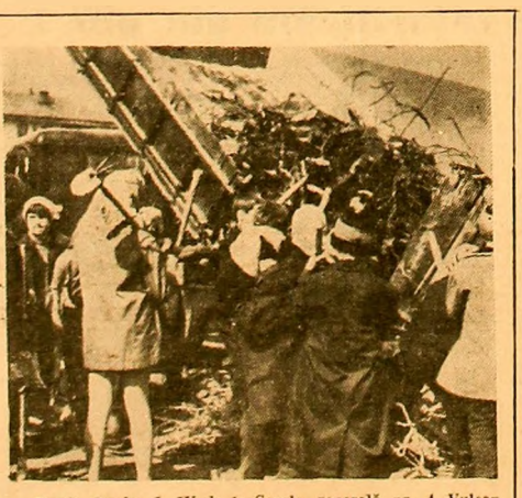
Elevii claselor I-IV de la Școala generală nr. 4 Vulcan, față în față cu... „roadele” muncii lor.

INTREBARE: Vă rugăm să informați pe cititori de semnificație are declararea lunilor martie și aprilie ca luni ale bunei gospodărie și infrumusețării a localităților?