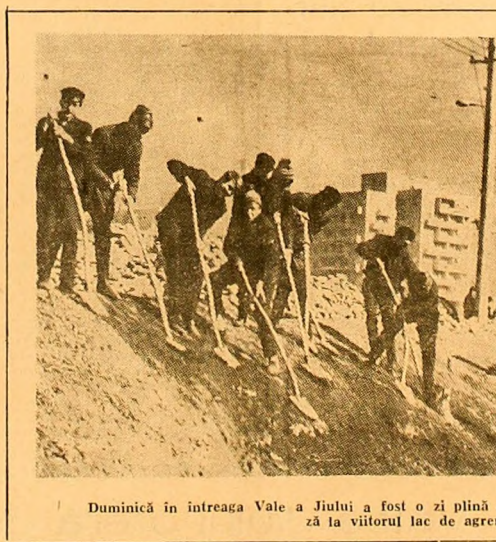
Duminică în întreaga Vale a Jiului a fost o zi plină de muncă patriotică. În clișeu, elevii din Petroșani lucrează la viitorul lac de agrement din localitate.

În ansamblul vieții din fiecare localitate a Valei Jiului cluburile sindicatelor au sarcini bine determinate — satisfacerea cât mai corectă a necesităților culturale-artistice, asigurarea unui cadru prielnic pentru petrecerea plăcută și profitabilă sub raport instructiv și educativ, a timpului liber al salariaților din unitățile economice.