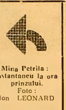
Mina Petrita: instantaneu la ora prinzului.

Fabrica de oxigen din Livezeni al cărei flux tehnologic este continuu, fără oprire în zilele de duminică, produce deja, în această duminică, primele sute de litri oxigen pentru planul trimestralului II al anului.