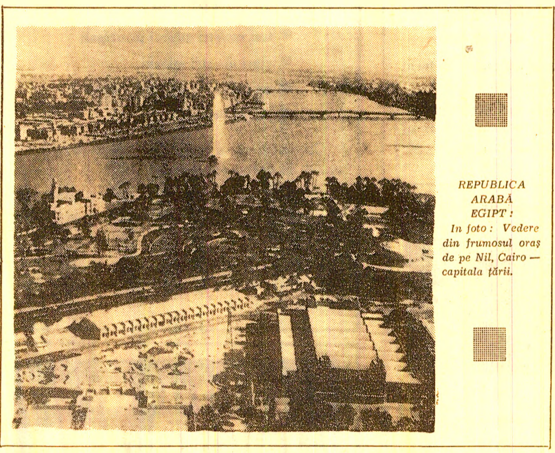
REPUBLICA ARABĂ EGIPTE: În foto: Vedere din frumosul oraș de pe Nil, Cairo — capitala țării.

PARIS 24 (Agerpres). — Într-o declarație comună — relatată de agenția Associated Press — delegațiile Statelor Unite și administratiile saigoneze la Conferința de la Paris în problema Vietnamului au respins propunerea făcută de reprezentanții R. D. Vietnam și ai Guvernului Revoluționar Provizoriu al Republicii Vietnamului de Sud privind reluarea lucrărilor conferinței în ziua de joi, 25 mai. După cum se știe, convorbirile de la Paris au fost întrerupte la 4 mai, în mod unilateral, de delegațiile americane și saigoneze.