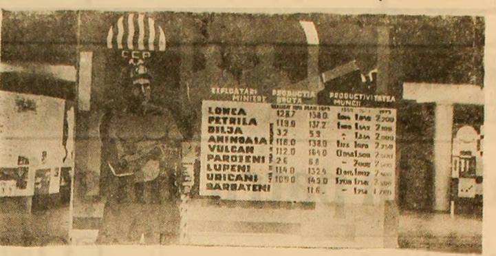
Panoul întâlțind dinamica producției de cărbune a minelor Văii Jiului

Printr-o manifestare cultural-artistică închinată Conferinței Naționale a P.C.R., care și va desfășura lucrările între 19-21 iulie a.e., se numără și expoziția realizărilor economice și social-culturale din Valea Jiului, găzduită în aceste zile de Casa de cultură a sindicatelor din Petroșani.