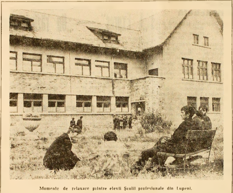
Momente de relaxare printre elevii Școlii profesionale din Lupeni.