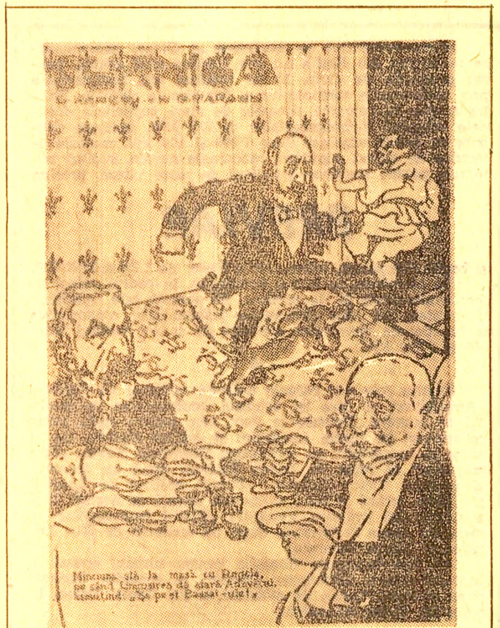
Caricatură antimonarhică în presa vremii.