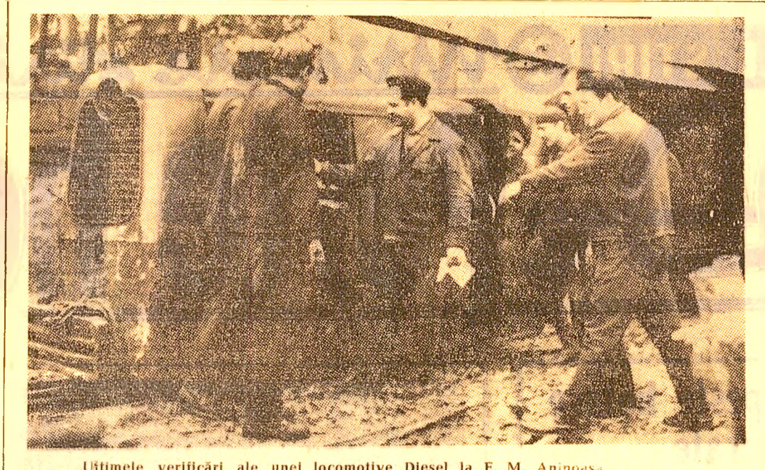
Ultimele verificări ale unei locomotive Diesel la E. M. Aninoasa.

operativ curent unor salariați cu funcții de execuție (contabil principal, economist principal), în timp ce funcțiile de conducere (director, inginer șef, contabil șef) nu li s-au încredințat, asemenea atribuțiilor, dosi conducerea unității trebuie să fie în fruntea celor ce exercită acest gen de control. Pe de altă parte, s-au atribuit unor salariați sarcini și obiective de verificare care de regulă formează obligații curente de serviciu, ca de exemplu, la E.M. Vulcan se luau serviciului mecanic-energetic li s-a atribuit ca obiective de verificare urmărirea încadrării materialelor și manoperei în prețul de cost, urmărirea comenzilor neterminate sau a celor aflate în lucru etc. În schimb, au fost omise obiective importante ca verificarea modului de întocmire și manipulare a documentelor de evidență tehnico-operativă, fapt ce ar fi putut preveni situații de gen celor constatate ulterior, de organetele de control financiar, ca de exemplu a constatărilor privind hucurile de materiale pentru echipamentul de protecție al uciilor de la Fabrica de stâlpi hidraulici din Vulcan care erau întocmite și semnate chiar de ucenicii solicitanți. An enumerat doar câteva exemple din care se desprinde o primă concluzie: în exercitarea sa, controlul exclude orice formalism. Acesta — formalismul — nu poate conduce decât la repelarea la nesfârșit a deficiențelor, la acoperirea unor grave abateri pe linie financiară.