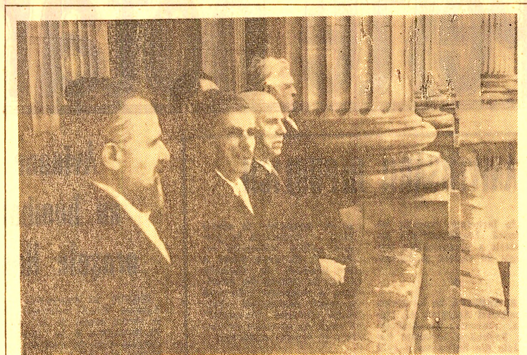
Membrii Prezidiului Provizoriu, după proclamarea Republicii, la 30 decembrie 1947. De la stînga la dreapta: Șt. Voitec, I. Niculi, C. I. Parhon, primul președinte al prezidiului, C. Siere, M. Sadoveanu.

În decursul istoriei, exprimând aspirațiile de libertate și independență ale poporului... arăta tovarășul Nicolae Ceaușescu — patrioții cei mai luminați au născut către o formă de stat democratică, progresistă, care să asigure libertate și dreptate socială pentru cei mulți, neatințarea politică și înflorirea economică a țării, să înlătuască dreptul sacru al poporului de a fi singur stăpîn în patria sa strămoșească.