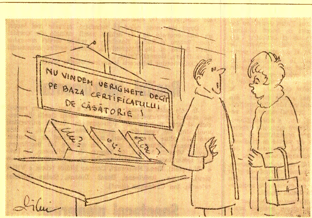
— Ți-am spus, draga mea, că tot mai bine e să ne căsătorim și pe urmă facem logodna.

Cine își îngăduie să schimbe, la întimplare, destinul unei familii?