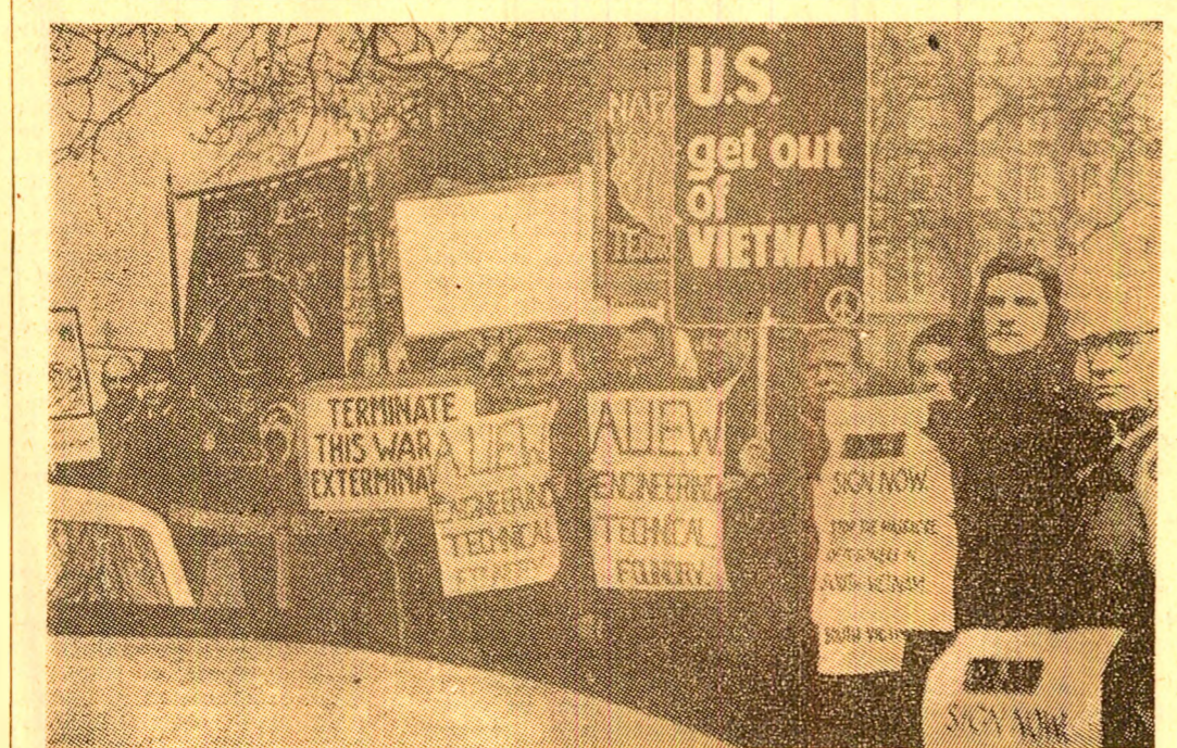
ANGLIA — Recent, la Londra a avut loc o nouă demonstrație împotriva reluării bombardamentelor de către S.U.A. asupra teritoriului R.D. Vietnam. În FOTO: Aspect de la demonstrația care a avut loc la Londra.