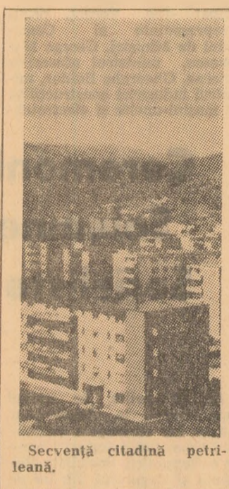
Secvență citadină petrițeană.

din Oradea, care se va deschide luna aceasta în Capitală. Asociația artiștilor fotografi întretine relații cu asociații similare din 70 de țări. În oaza colaborării sale cu Societatea daneză pentru fotografie, luna aceasta va avea loc la București deschiderea unei expoziții cuprinzând 100 de lucrări, în cea mai mare parte cu un bogat palmares internațional. După ce o expoziție reprezentativă românească de artă fotografică a fost itinerată prin mai multe localități din R.D. Germană, în toamnă, circa 80 de lucrări ale artiștilor fotografi din această țară urmează să fie expuse la București și în alte orașe din țara noastră. Din R.F. Germania va fi expedită, în vară, o expoziție color cu tema „Oamenii '73”, ale cărei imagini vor fi realizate de dr. Raimo Gareis, într-o tehnică nouă. În urma invitațiilor primite, artiștii fotografi români au participat cu lucrări, de la începutul anului și până acum, la 15 saloane internaționale. Menționăm dintre acestea saloanele din Valea Jiului din Belgrad, Cracovia, Martigues, Bristol, Potsdam. Recent, din România au fost expediate la Tokio o serie de lucrări ale artiștilor noștri pentru concursul de fotografii organizat sub egida UNESCO, avind ca temă „Copiii japonezi și copiii din toată lumea”.