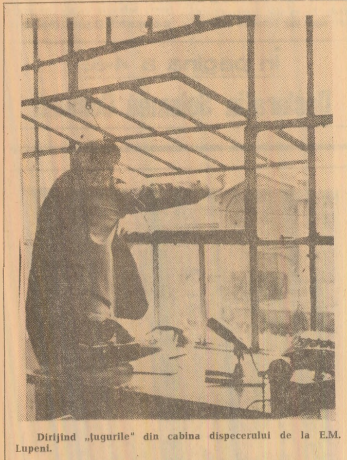
Dirijind „jugurile” din cabina dispecerului de la E.M. Lupeni.

Colectivul Uzinei de autocamioane „Steagul Rosu” din Brașov a realizat primul stand de rodaj electric fabricat în țara noastră, folosit pentru motoarele Diesel. Acesta asigură un control foarte riguros al funcționării motoarelor amintite. Pentru început, uzina brașoveană va realiza un prim lot de 19 standuri.