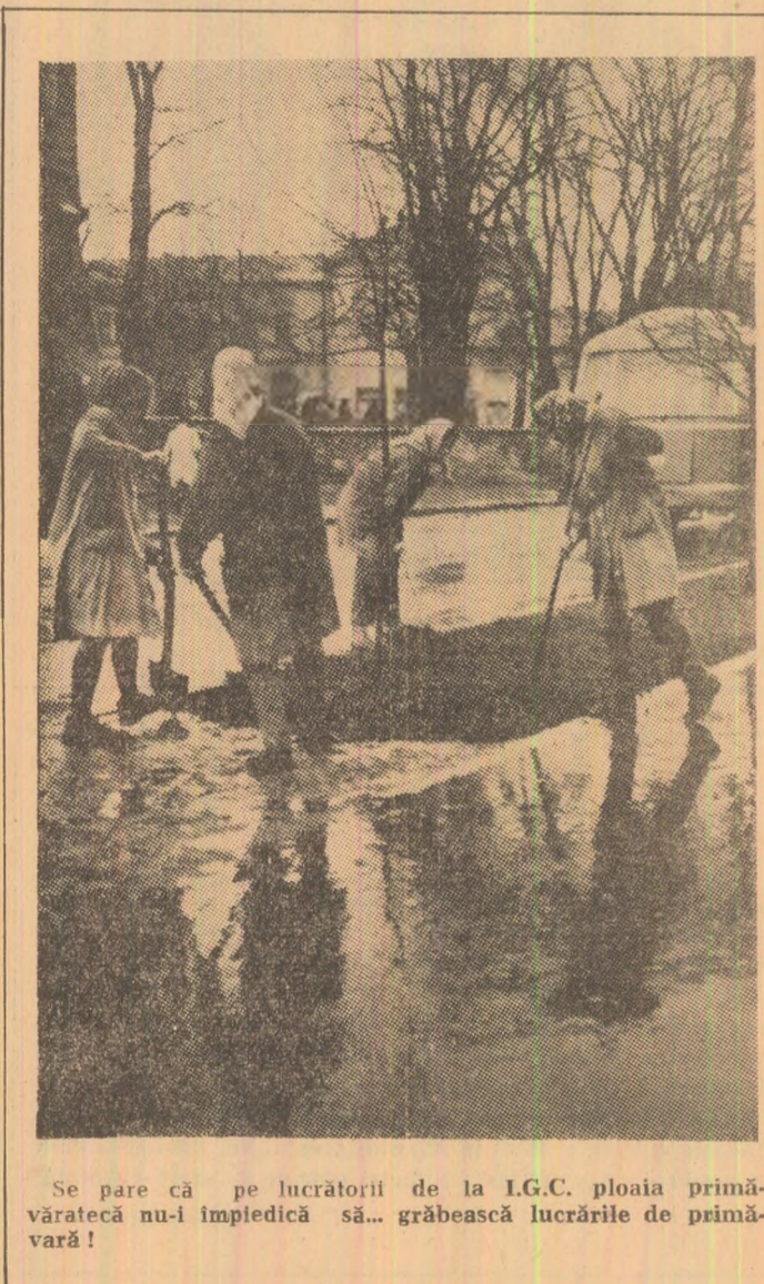
Se pare că pe lucrătorii de la I.G.C. ploaia primăvăratică nu-i împiedică să... grăbească lucrările de primăvară!