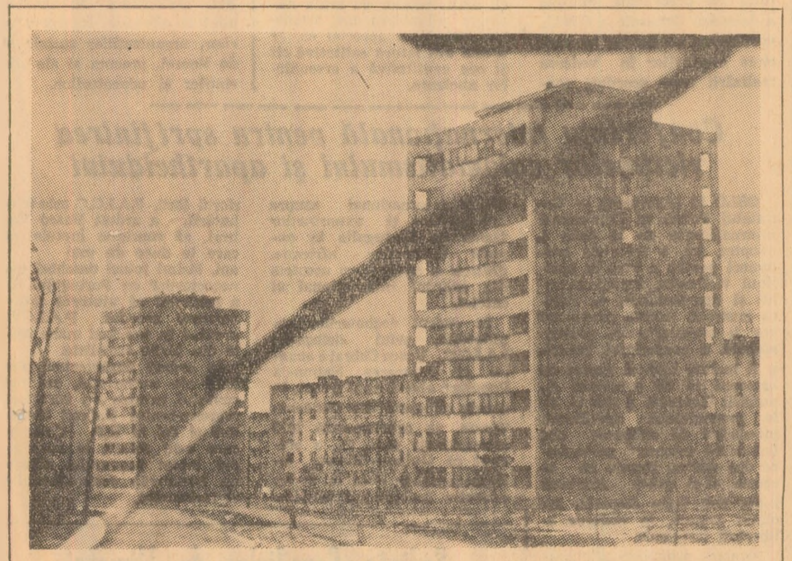
Chiar și din „fuga” autobuzului, obiectivul aparatului de fotografiat înregistră modernul pitoresc din vechea așezare petriteană.