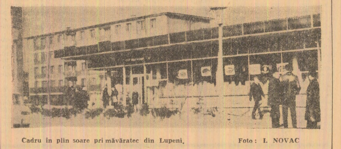
Cadru în plin soare primăvăratic din Lupeni.