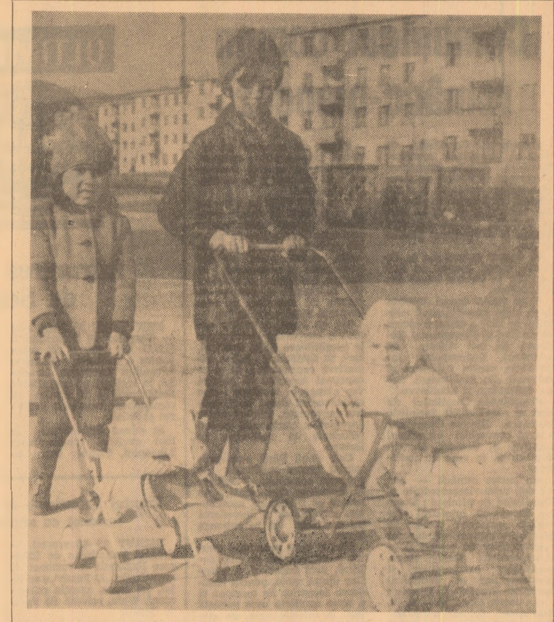
Instantaneu cu... „în caz minor”.

Specialiștii români din do- meniul automatizării au re- alizat un ceas numeric auto- mat, de mici dimensiuni, cu greutate redusă și consum mi- nim de energie. Aparat portu- bil, ceasul numeric românesc este echipat cu diode și tran- zistori cu siliciu, putînd să fie întrebunțat în operații de cronometrare, programare și înregistrare. Afisarea datelor se realizează cu ajutorul unui aparat special. El dovedește o înaltă precizie în măsura-