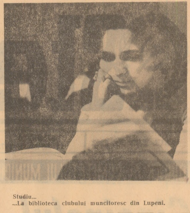
Studiu... ..la biblioteca clubului muncitoresc din Lupeni.

Astăzi, la ora 20, la Casa de cultură din Petroșani se inaugurează un ciclu de activități cultural-educative și distractive pentru tineri denumit „Serile tineretului petroșănean”. În program, sîntem informați, se află recitări, momente vesele, surprize, muzică și dans.