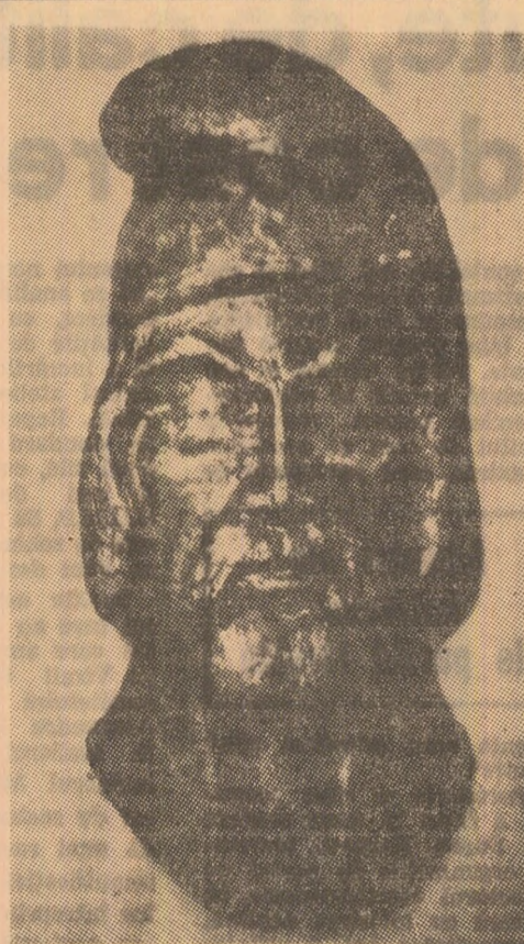
DAC Metaloplaste de Oscar BRÄUTIGAM

Apariția volumului memorialistic „Sint matematician” de Norbert Wiener reprezintă nu numai un eveniment editorial ci și unul cu semnificație mai profundă pentru circulația de idei și viața intelectuală din țara noastră. Norbert Wiener (1894 — 1964) a fost un om de știință complex care și-a consacrat viața unor căutări personale și într-o direcție proprie care se remarcă printr-o strînsă și permanentă legătură cu tehnica și științele naturii. Studiul analogiilor structurale dintre procesele care au loc în circuitelor electrice și procesele din alte sisteme tehnice, ca și analogiile cu procesele din organismele vii, au contribuit la fundamentarea ciberneticii. Lucrarea sa „Cibernetica” (1948) a exercitat o puternică influență asupra dezvoltării științei mondiale. În cartea „Sint matematician” autorul își prezintă drumul său în știință, experiențele și trăirile, multe idei și reflecții care se adresează nu numai oamenilor de specialitate, ci unui larg cerc de cititori.