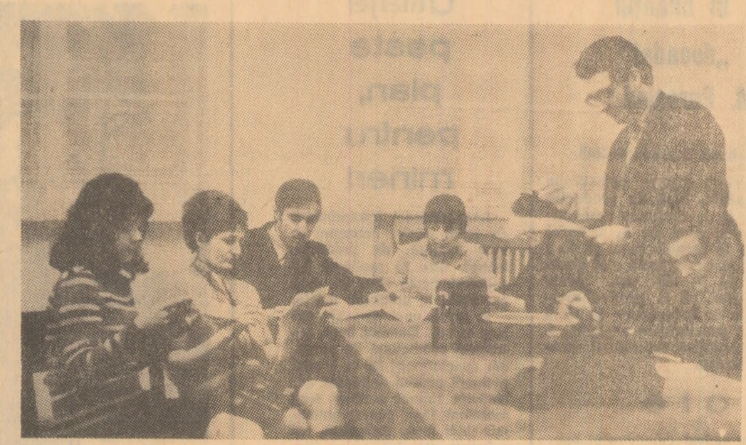
Se face lectura, la masă, a unei noi piese de teatru, pe care în curînd, amatorii o vor prezenta în... luminile rampei...