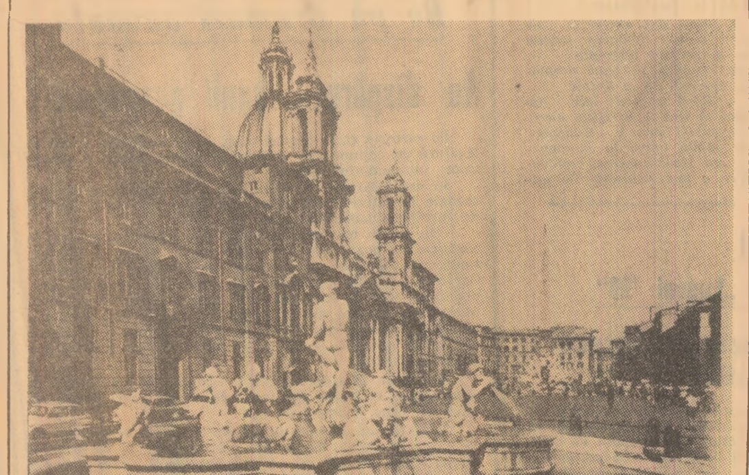
Piața Navona, important centru al Romei, celebră prin ine des Fleuves, Fontaine du Maire și Fontaine de Neptune.