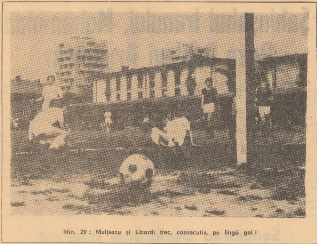
Min. 29 : Mulțescu și Libardi trec, consecutiv, pe lângă gol!