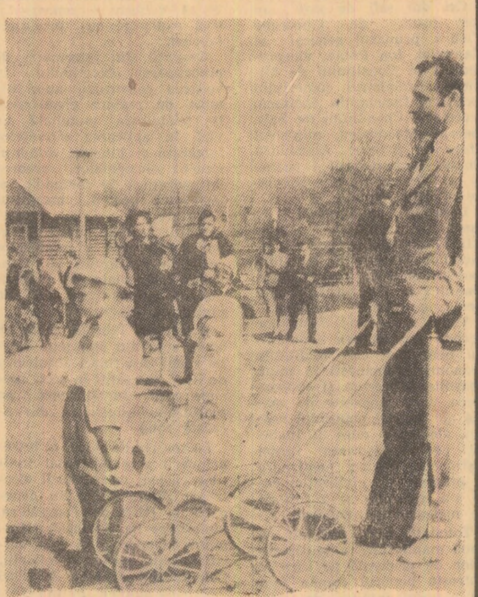
La plimbare cu tălicu...

Organele și organizațiile de partid au datoria să lupte pentru respectarea neabătută de către toți membrii de partid a normelor vieții de partid, pentru dezvoltarea democrației, întărirea disciplinei, fapt care va contribui la întărirea rolului conducător al partidului în întreaga noastră viață socială.