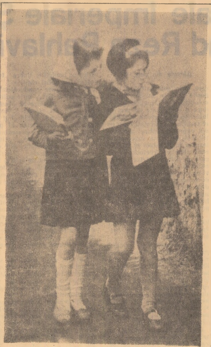
O prietenă așteptată cu mult interes: revista I Foto: A. RIEGELHAUPT