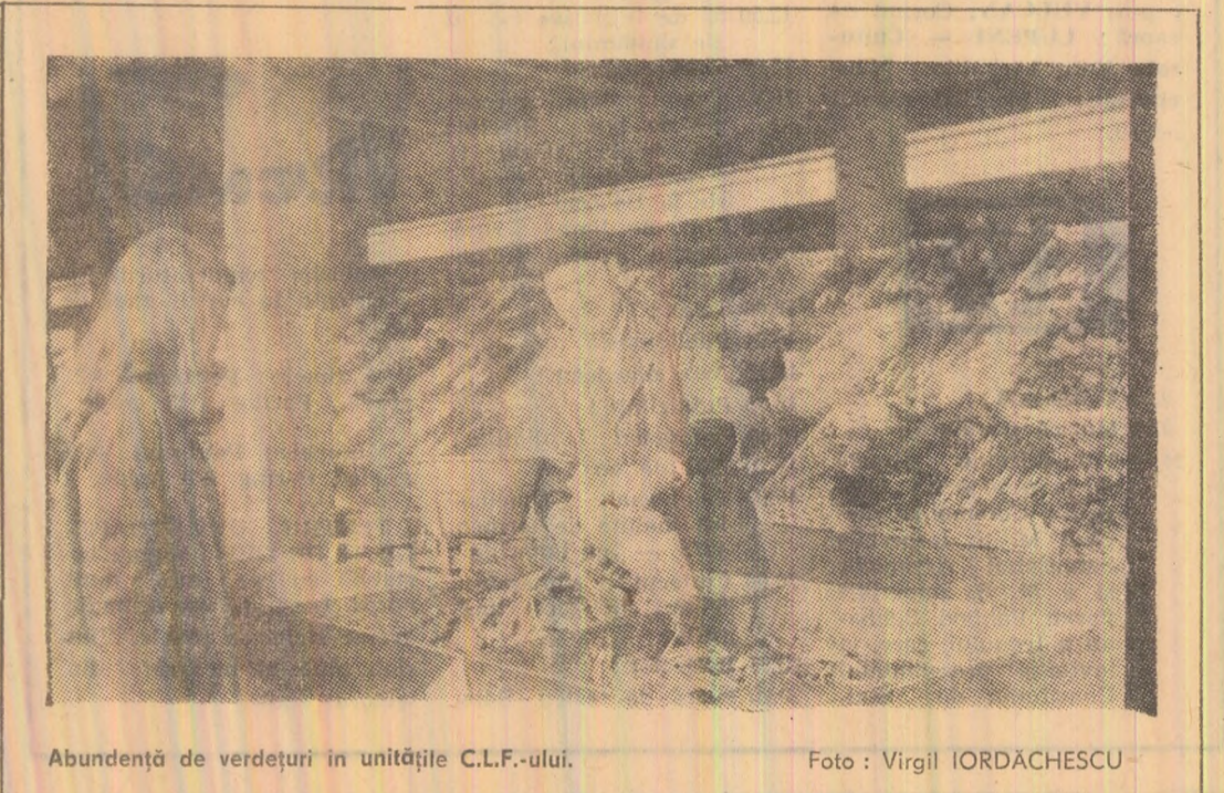
Abundență de verdeturi în unitățile C.L.F.-ului.