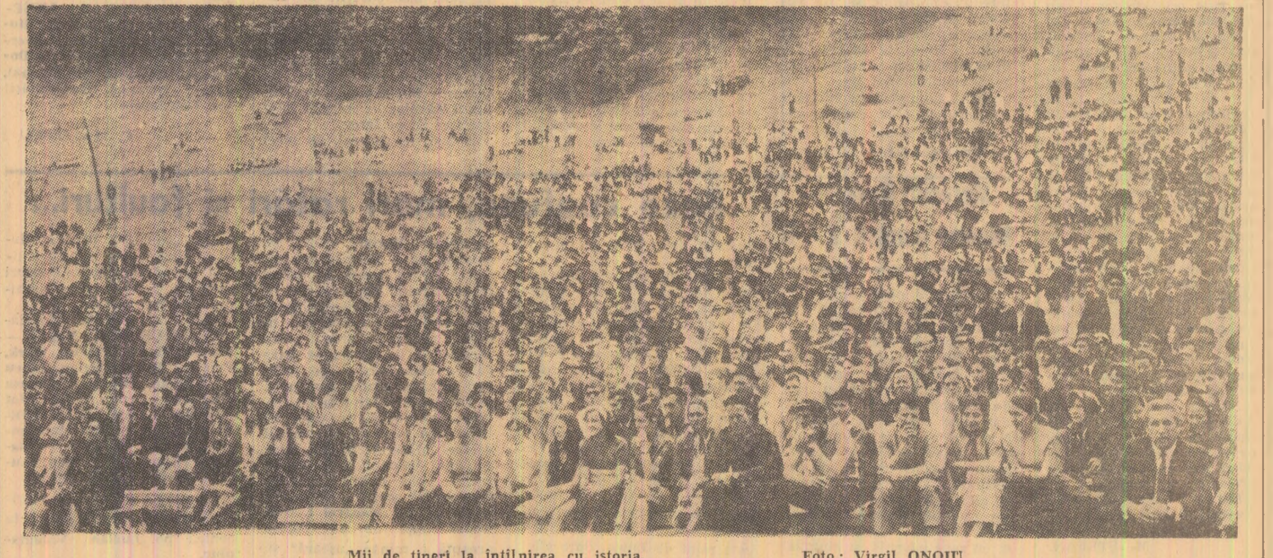
Mii de tineri la întîlnirea cu istoria.