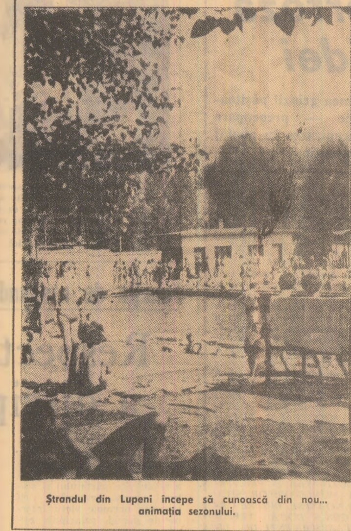
Ștrandul din Lupeni începe să cunoască din nou... animația sezonului.