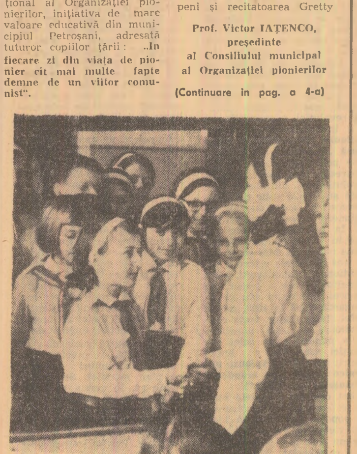
Felicitări și succes în activitate...