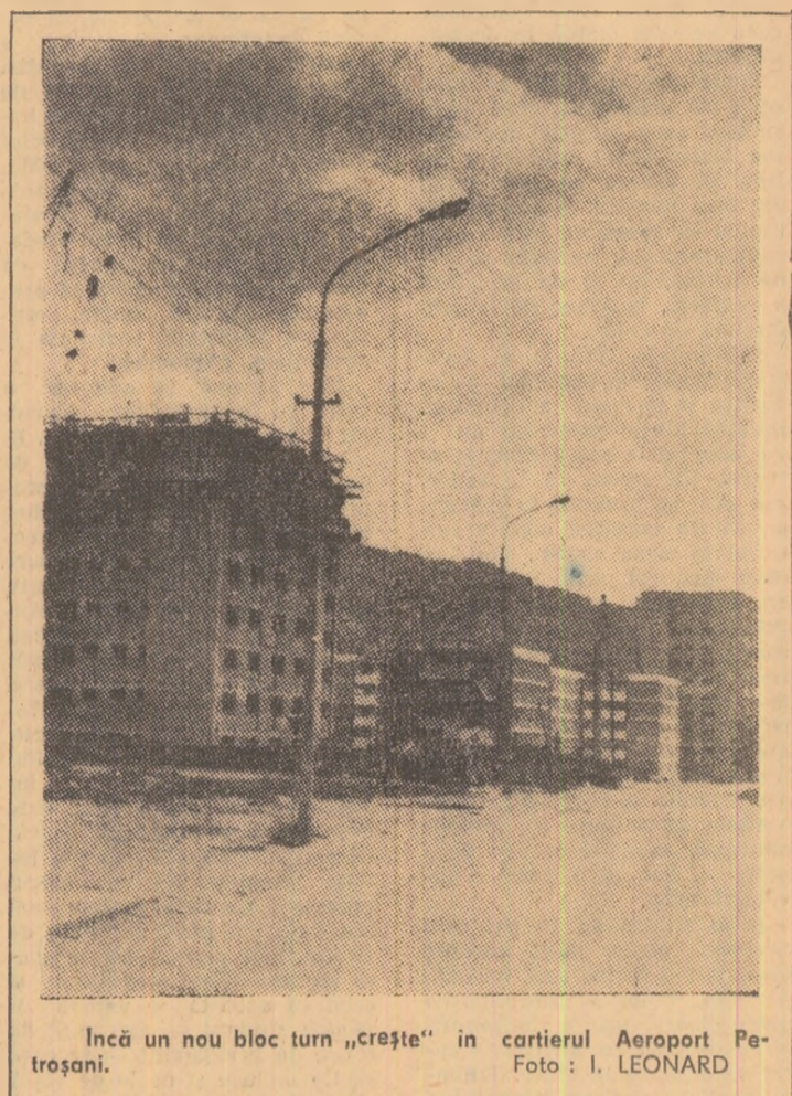
Încă un nou bloc turn „crește” în cartierul Aeroport Petrosani.