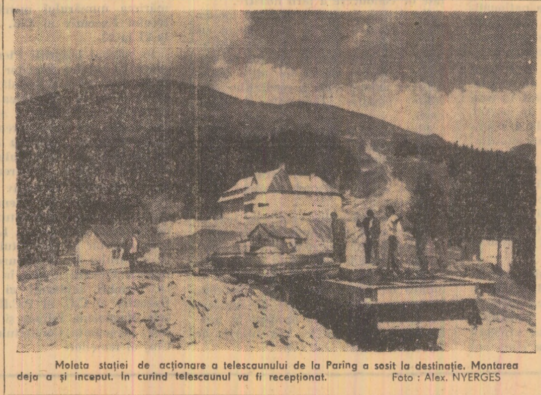
Molata stației de acționare a telescaunului de la Paring a sosit la destinație. Montarea deja a și început. În curînd telescaunul va fi recepționat.

Prin activitatea rodnică a întregului centru — livezeni, Pa-roseni, Lupeni, Dealul Babil, Arcanul, Valea de Pesti, Buta Blugul (Uricani), Pleșa — dispuse geografic pe raza municipiului, și anul acesta sînt posibilități de onorare integrală a planului de achiziționare a fructelor de pădure.