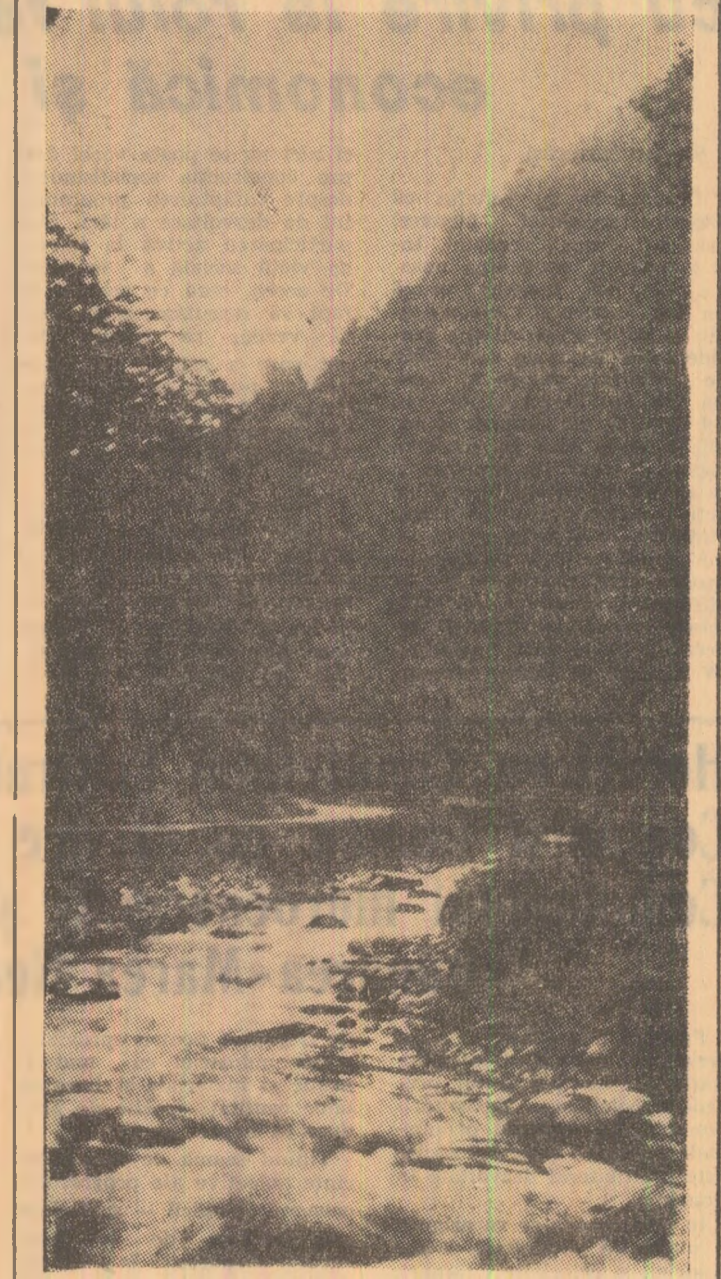
Însoțind apar de cleștar, drumul dăruit în piatră se străcoară prin Cheile Jijetului.