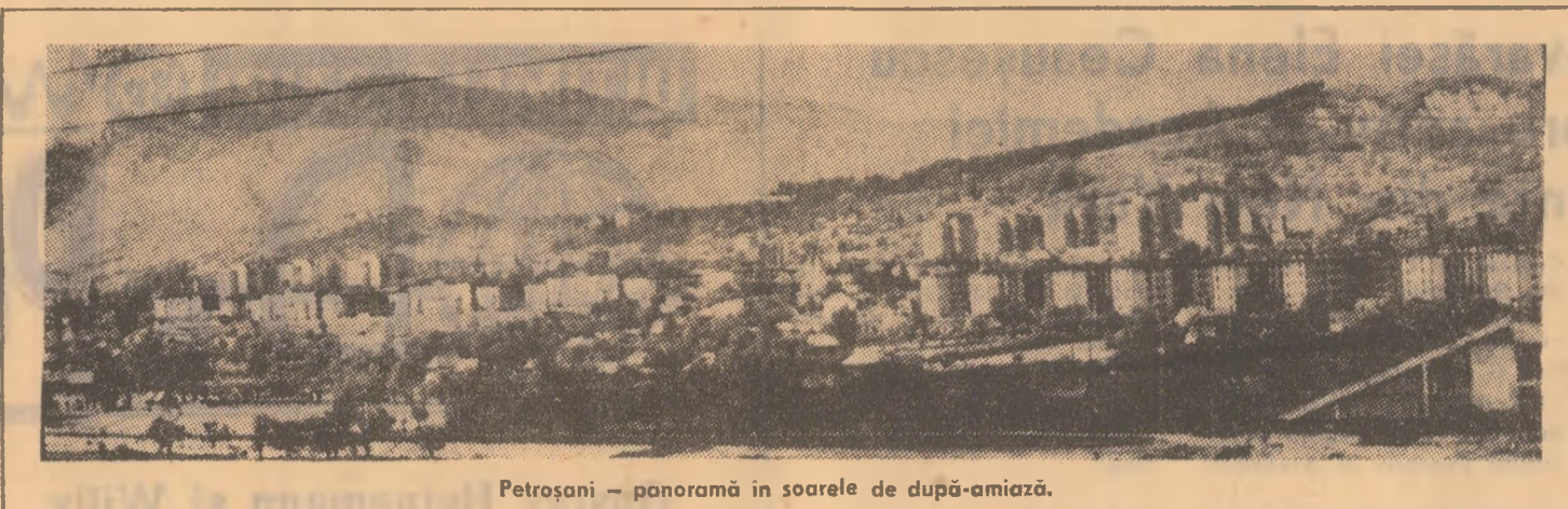
Petroșani — panoramă în soarele de după-amiază.

În acest sens trebuie să acționăm în viitor spre a putea obține o schimbare radicală în promovarea femeilor, în participarea lor la conducerea tuturor sectoarelor de activitate din societatea noastră socialistă. Astfel problemele își vor găsi soluțiile corespunzătoare și nu ne vom amîni de ele numai la 8 martie și la diferite plănuri. Acestea trebuie să fie preocupări zilnice — parte integrantă a întregii noastre activități. Nu doresc să mă opresc la problemele de educație, de etică și echitate socialistă pentru că acestea sînt probleme generale. Femeile trebuie să acționeze în cadrul activității generale politico-educative în același mod în care acționează toată lumea. Rezolvînd mai bine problemele participării femeii la viața socială, făurirea societății socialiste multilaterale dezvoltate în România se va putea realiza. Sînt convins că Comitetul Central va fi de acord cu acest mod de a judeca lucrurile și că în hotărîrea noastră, mai cu seamă în activitatea noastră viitoare, acest spirit își va găsi expresie, se va reflecta în