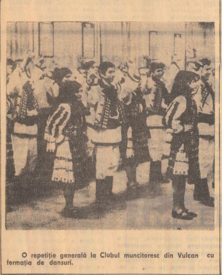
O repetiție generală la Clubul muncitoresc din Vulcan cu formația de dansuri.