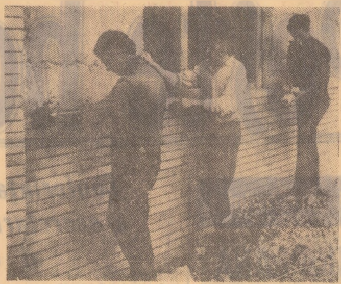
Grupul participanților la finala „Olimpiadei zidarilor” după încheierea probei practice.