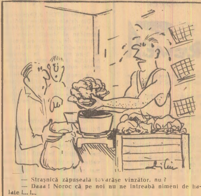
Strănsnică zăpuseală tovarășe vinzător, nu? Daai! Noroc că pe noi nu ne întrebă nimeni de halate...