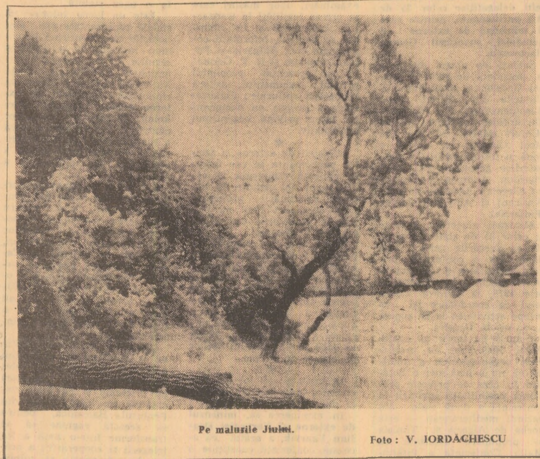
Pe malurile Jiului.