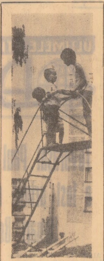
Mă lăși pe mine primul că-s mai mic!