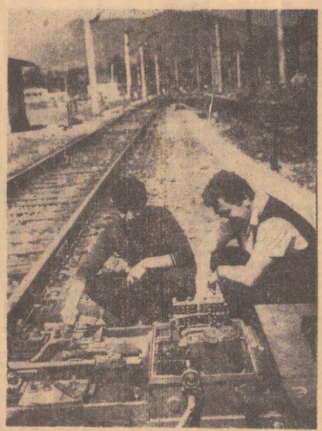
Ultimele verificări ale electromecanismelor de acționare a macazelor și aici nu se admit erori.

In pag. a 4-a: DECLARAȚIA SOLEMNĂ COMUNĂ A REPUBLICII SOCIALISTE ROMÂNIA ȘI A REPUBLICII POPULARE CONGO.