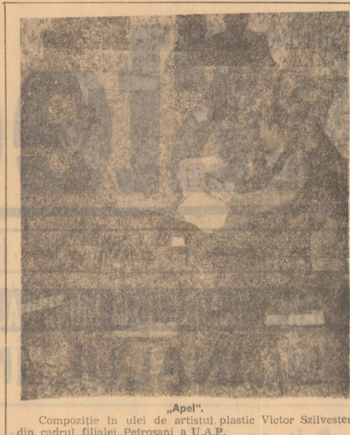
„Apel”. Compoziție în ulei de artistul plastic Victor Szilvester, din cadrul filialei Petrosani a U.A.P.