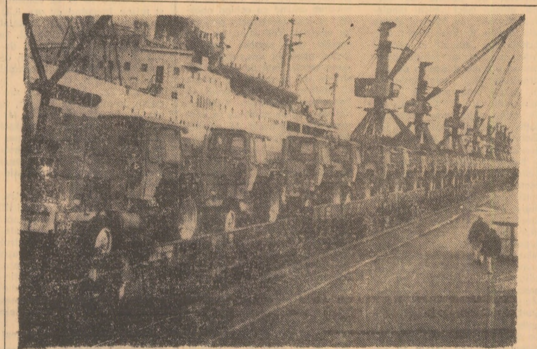
Tractoarele de tip ZT 300 sunt exportate de R.D.G. în R. S. Cehoslovacia, Cuba și în Chile...