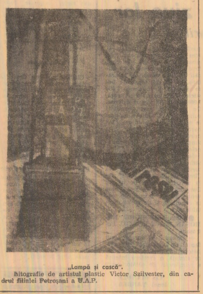
„Lampă și cască”. Bitografie de artistul plastic Victor Szilvester, din cadrul filialei Petrosani a U.A.P.