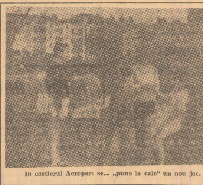
În cartierul Aeroport se... „pune la cale” un nou joc.

Pentru perioada 10—21 august 1973 conducerea Casei de copii școlari din Uricani, a organizat o tabără locală în munții Retezat cu un număr de 72 de elevi avînd ca scop petrecerea cit mai plăcută a vacanței de vară a elevilor, prin cunoașterea a-mănuntului a florii și faunei acestor zone alpine. Copiii sînt însoțiți de un număr însemnat de cadre didactice, de personal administrativ și medical. Impresiiile copiilor sînt nemărginit de plăcute; ei și-au manifestat dorința ca și vacanțele viitoare să le petreacă la fel de plăcut. Prof. Pompiliu CARAGEA corespondent