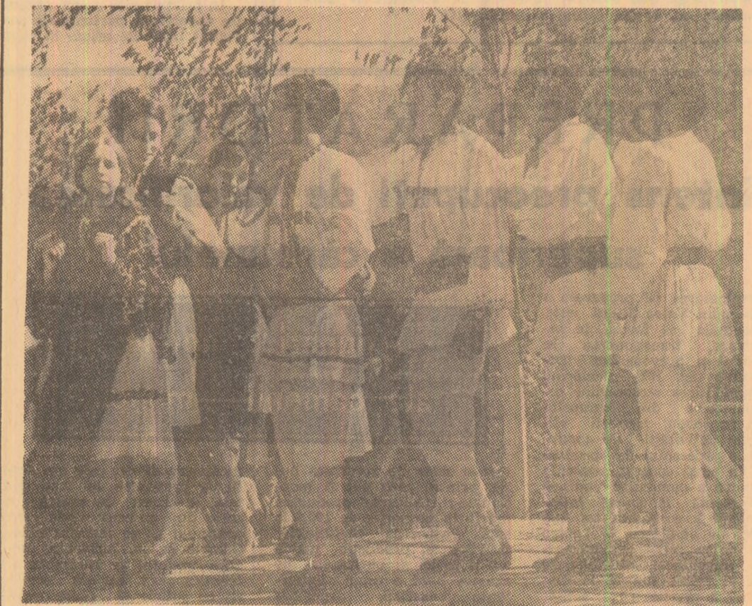
Pe estradă, formația de dansuri a căminului cultural din Iseroni prezintă dansul „momîrtănescul”.

Participa la Festivalul florilor de la Debrecen și ansamblul folcloric al căminului cultural din comuna Gropeni (jud. Brăila) la festivalul internațional de folclor de la Malines (Belgia). Este, de asemenea, prevăzută participarea Teatrului popular al Casei de cultură din Călărăși la cel de-al V-lea festival internațional al teatrului de amatori de la Monaco, precum și a formațiilor corale „Paul Constantinescu” a Palatului culturii din Ploiești și „Viva la musica” a Casei de cultură din Cluj, la cel de-al XXI-lea concurs polifonic internațional „Guido d'Arezzo” (Italia) și, respectiv, al XII-lea concurs internațional de cor „C. A. Seghizzi” de la Gorizia (Italia).