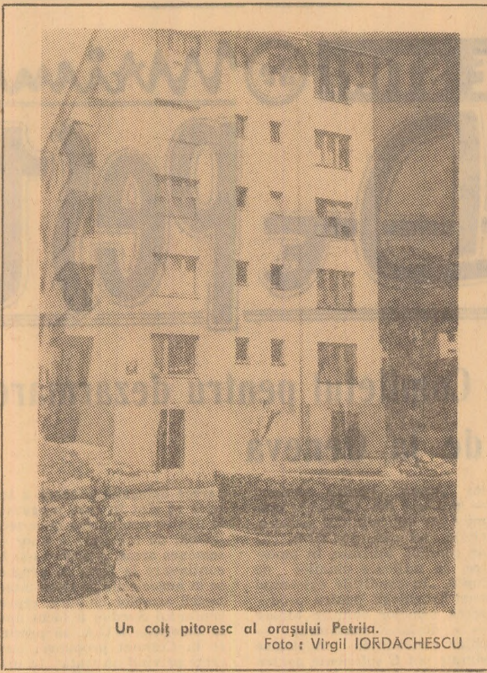
Un colț pitoresc al orașului Petrița.

Calificativul „bine” acordat de adunarea reprezentanților salariaților activității comitetului oamenilor muncii este alături de recunoașterea a stăruințelor depuse pînă acum, cit și o obligație de a contribui în continuare la mobilitatea tuturor salariaților din cadrul E.P.C.V.J. pentru îndeplinirea exemplară a sarcinilor importante ce le revin în scopul valorificării tot mai superioare a producției de cărbune a bazinului.