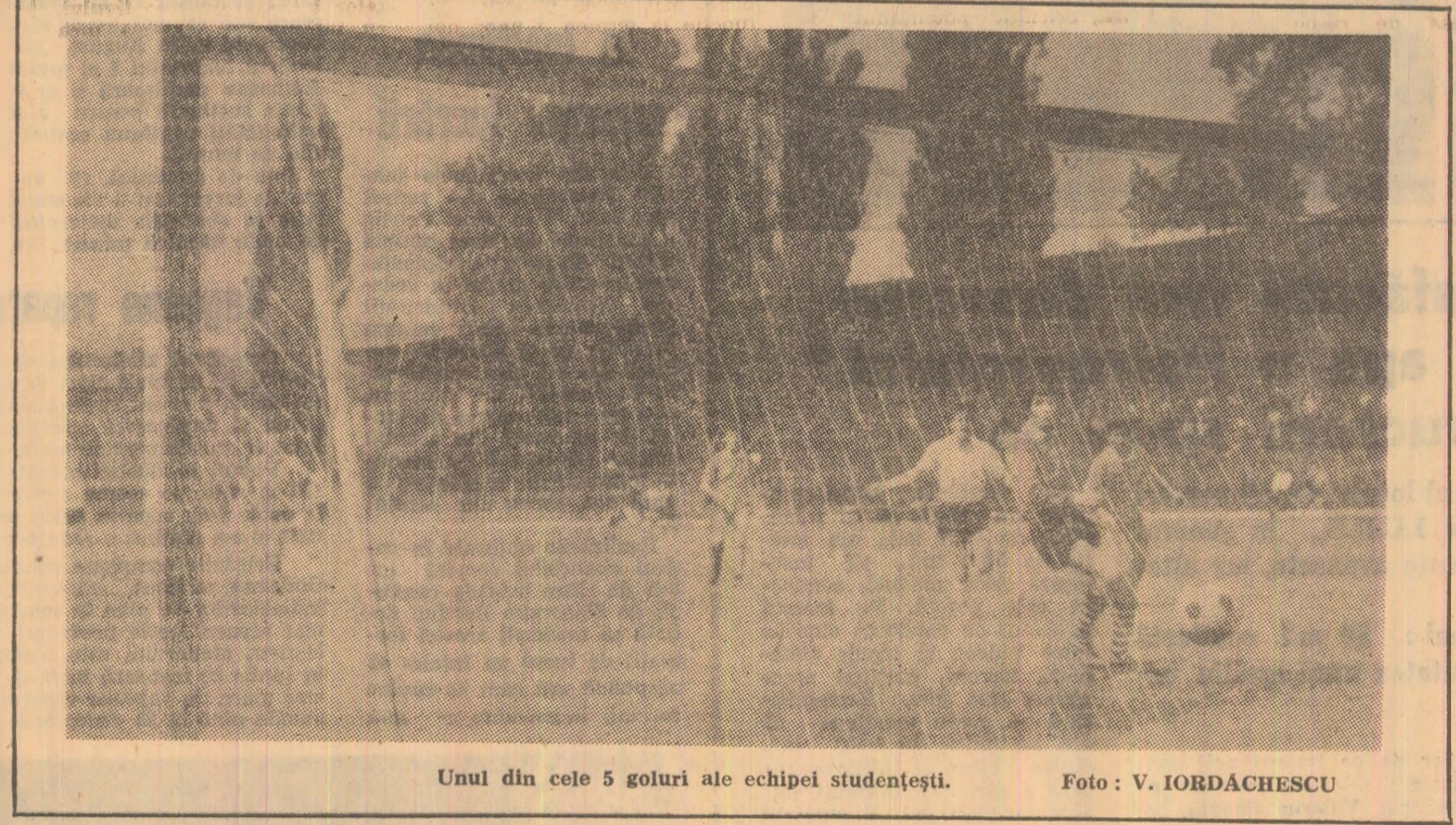
Unul din cele 5 goluri ale echipei studențești.