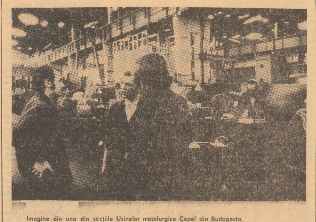
Imagine din una din secțiile Uzinelor metalurgice Cepel din Budapesta.