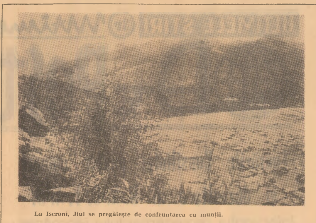
La Iacroni, Jiul se pregătește de confruntarea cu munții.

La Centrala cărbunelui Petroșani, de exemplu, principalele probleme care au făcut obiectul studiilor au fost programarea execuției lucrărilor miniere, posibilitatea extinderii abatoajelor frontale în stratul 3 și organizarea muncii pentru realizarea a două cicluri pe zi, organizarea de locuri de muncă model, îmbunătățirea organizării muncii și creșterea capacității de producție a atelierelor mecanice, extinderea lucrului în acord la formațiile de deservire etc.