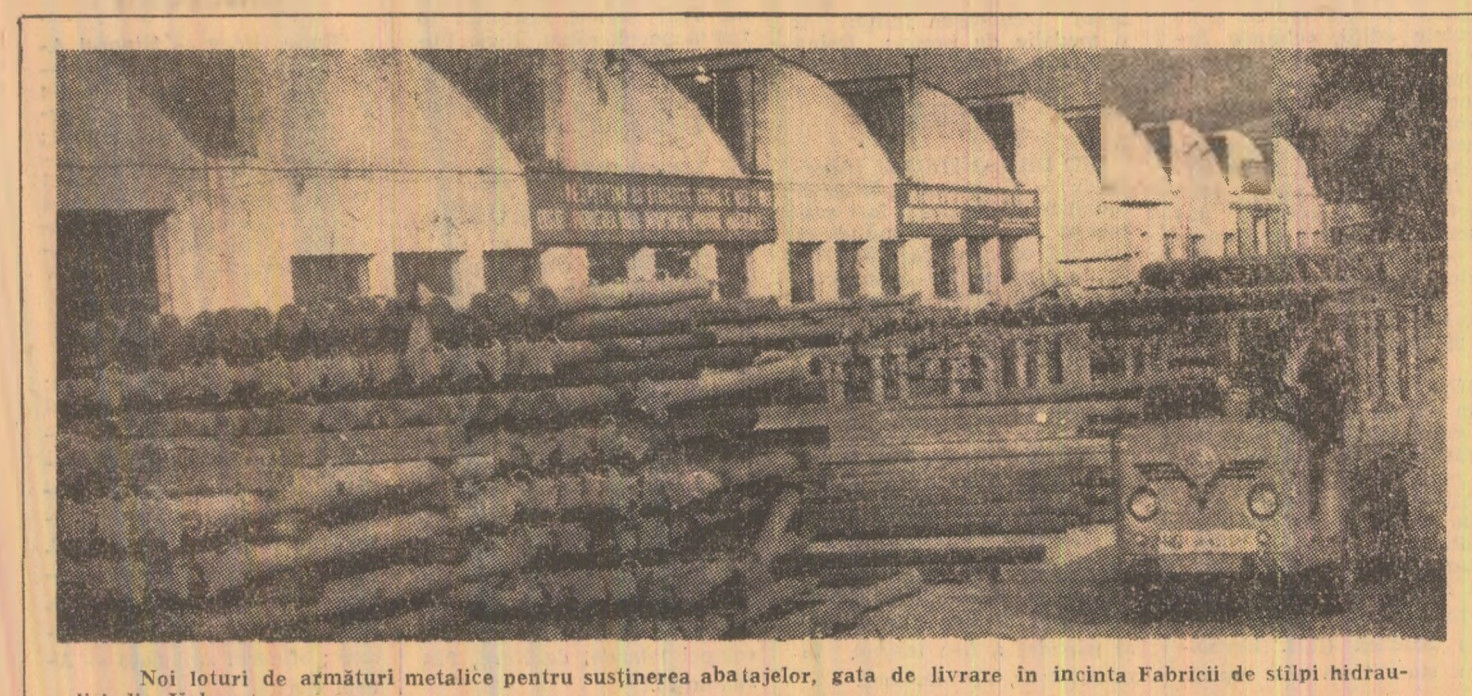
Noi loturi de armături metalice pentru susținerea abatoajelor, gata de livrare în incinta Fabricii de stîlpi hidroalici din Vulcan.