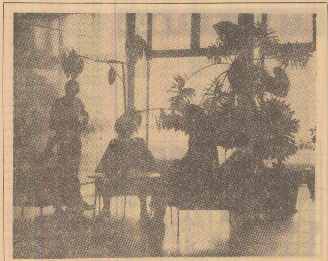
Moment de răgaz în foaierea Casei de cultură din Petroșani.

regiune a Cubei, precum și din regiunile învecinate Marianao și Ariqua. Școala, prin însăși structura construcției sale și loturile de pămînt ce-i sînt alocate, și-a propus să asigure un proces de învățare