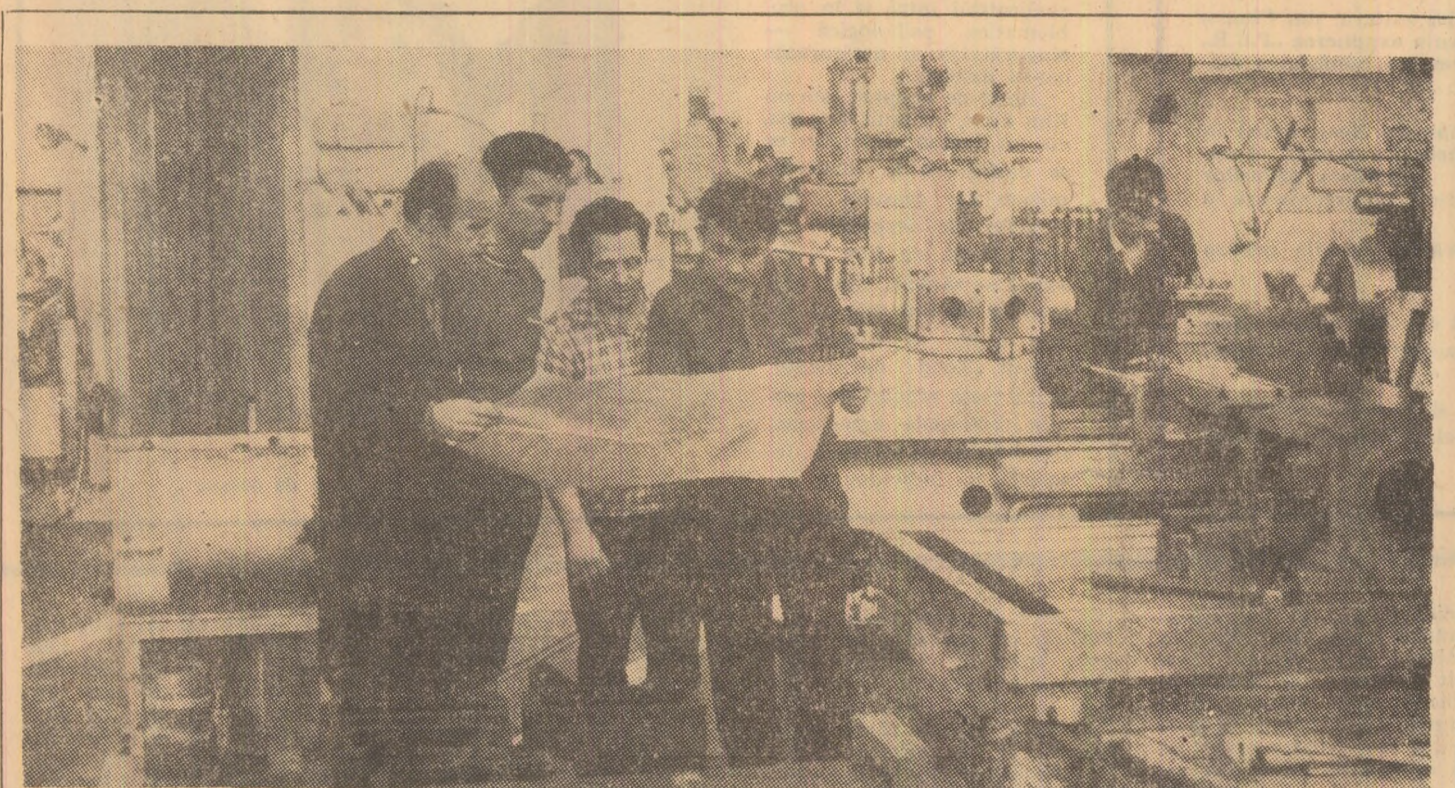
Execuția la timp și în condiții de calitate ireproșabilă a reperelor constituie o preocupare permanentă a colectivului de la F. S. H. Vulcan. În acest scop urmărirea planului de operație se află mereu în atenția personalului tehnic, după cum se poate vedea în instantaneul nostru.

Rezultatele n-au întârziat să se arate, astfel, la bilanțul dintre cele două etape ale întrecerii, făcut la începutul lunii septembrie de comisia județeană pentru întrecerea în munca patriotică, orașului Petrița i s-au acordat 1500 de puncte pentru lucrările executate în valoare de 16.000.000 lei. Un punctaj care obligă.