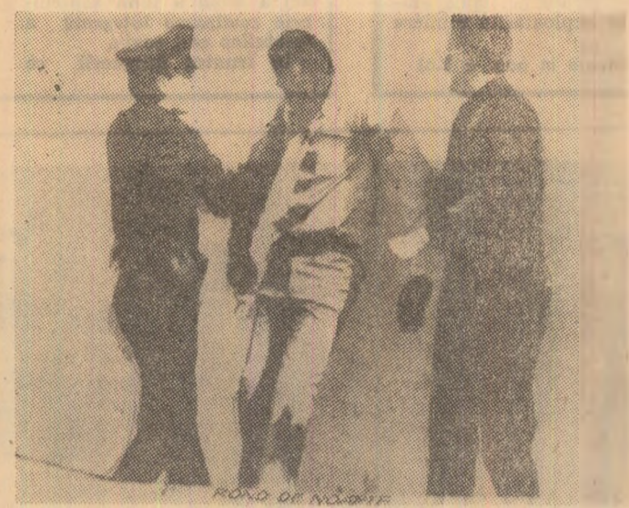
Secvență din filmul „Rond de noapte”.

Un film inspirat dintr-un roman semnat de un agent de circulație californian și avînd sensul unui elogiu a-dus spiritului de sacrificiu al unor poliști cinști, angajați cu întreaga ființă în lupta împotriva infractorilor și a criminalității crescînde din Statele Unite. Re-luând aspecte ale existenței cotidiene, uneori epuizante, a apărătorilor legii, realizatorii intră și în problematica psihologică — singurătatea și nesiguranța care-i macină. „Rond de noapte” este un film alert, cu mult suspens, cu un tempo dramatic ce se desfașoară în cartierele mizere ale orașului Los Angeles. Se desprinde și semnificația de film critic, social — sărăcie, lipsa mijloacelor de trai este adevărata sursă a infracțiunii. Filmul „Rond de noapte” arată viața omului din marile metropole americane, singurătatea și alienarea lui socială și individuală.