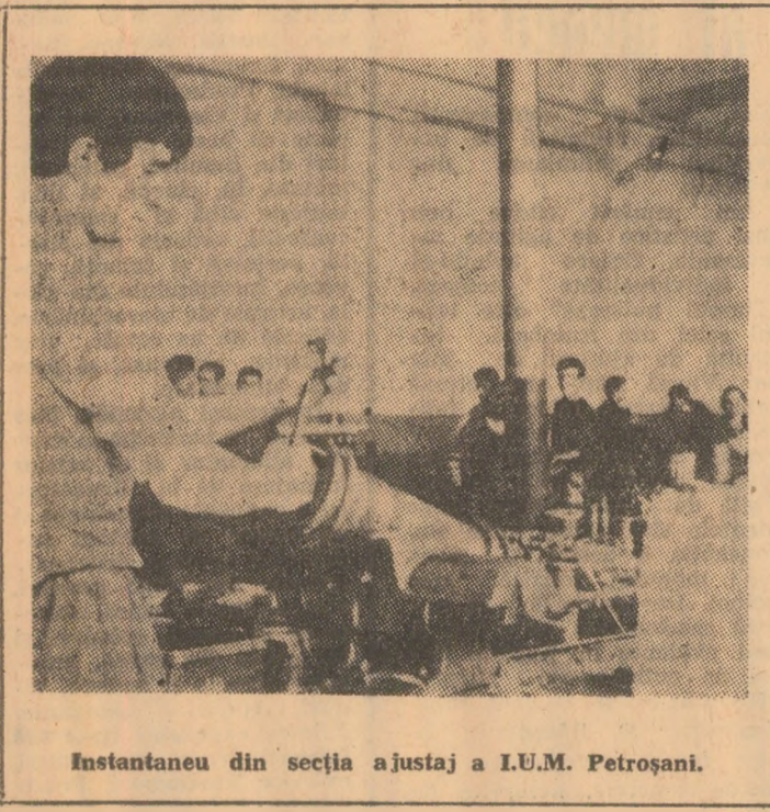
Instantaneu din secția ajustaj a I.U.M. Petroșani.

liste România”. Cu o lună înainte de adunarea generală a fost întocmită o bogată tematică și un amplu material bibliografic care s-a orientat studiul comuniștilor,