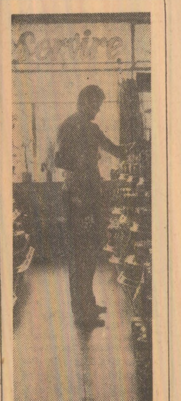
Instantaneu în unitatea nr. 12 — Autoservire Aeroport—Petrosani.