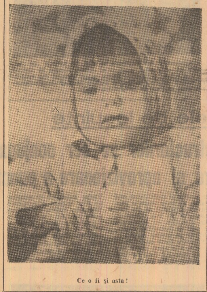
Ce o fi și asta!

Deunăzi, întîlnindu-l pe amicul Gologan, l-am văzut destul de abătut. Parcă i s-ar fi înecat corăbiile. Nu, nu era bolnav. Alceva îl câtrînisise: de vreo lună, omul de la aprozar vine și pleacă de la slujbă cu o „Skodă”, ospătarul său rotofel și-a construit, cică, o locuință proprietate personală. Pe cînd el, Gologan, cu ce s-a ales? Doar cu faimoasa I.R.M.F. Parale aruncate pe apa Sîmbetei! Aș, căci din aceste parale, bacșișomanii și-au putut cumpăra cel puțin cîte-o roată din autoturismele lor și o bucată din zidul locuinței personale. Deci, într-un fel, prietenul meu poate fi bucuros pentru mărînchia lui. Și cred că ar fi potrivit ca inițialele I.R.M.F. să le adaug și pe ale acestor P.B.F.S.I.O.B. Ce ar însemna ele? Pentru binefăcerea filantropică și îngrășarea oisnelz bacșișomanilor. N. PALTIN