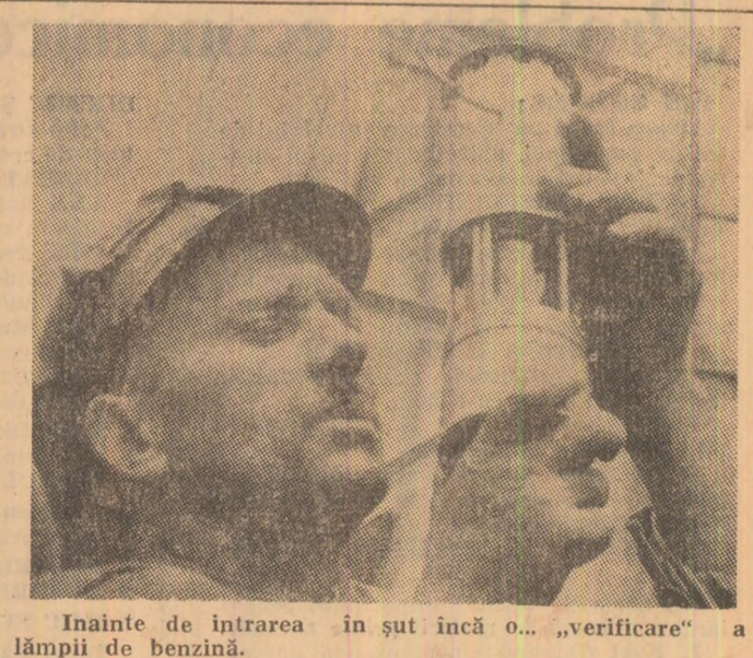
Înainte de intrarea în șut încă o... „verificare” a lămpii de benzină.

Între 6 și 21 octombrie, țara noastră va fi prezentă, pentru prima oară, la Tirgul internațional de la Dallas. Întreprinderile românești de comerț exterior Centralimpex, Tricoexport, Confex, Stirox, Romanexport, Bomsi, Iccoop, Ilexim, Eximcoop, Romprosilatelia, Prodexport, Fructexport și Vinexport vor expune cu acest prilej, țesături din bumbac, poliesteri, mătase, in, cîneapă, și lînă, lenjerie albă și colorată, confecții, articole din sticlă, porțelan și faianță, covorașe, încălțăminte din piele, articole de marochinărie, articole de uz casnic, mic mobilier, artizanat și produse alimentare. În aceeași perioadă, țara noastră va participa la salonul alimentar și al artelor menajere de la Bruxelles, cu o expoziție alimentară și de bunuri de consum cuprinzînd covorașe, artizanat, articole din sticlă gravată, obiecte din ceramică, obiecte de uz casnic, conserve și preparate din carne, vinuri, fructe și legume, brînzuri, coniac, șampanie. Printre expozații figurează și întreprinderile de comerț exterior Prodexport, Fructexport, Eximcoop, Ilexim, Iccoop și Vinexport. (Agropres)