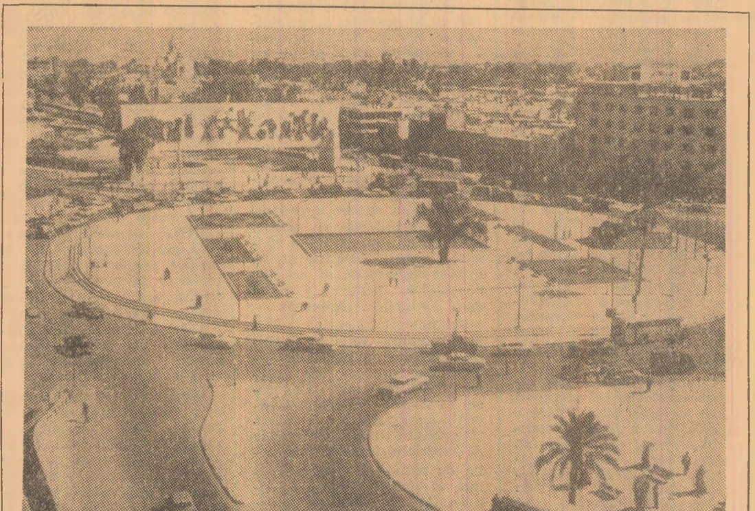
IRAK. Vedere panoramică din piața Al Tahrir din Bagdad, una din cele mai mari piețe ale orașului unde va fi construit un mare tunel deschis traficului auto care va cuprinde și un număr de 60 de magazine. Accesul publicului se va face cu ajutorul a 6 linii de scări electrice.

Bibliotecile centrale din orasul finlandez Valkeakoski i-au fost oferite din partea Ambasadei Republicii Socialiste România din Helsinki, un număr de 100 volume despre literatura, arta și turismul din România.