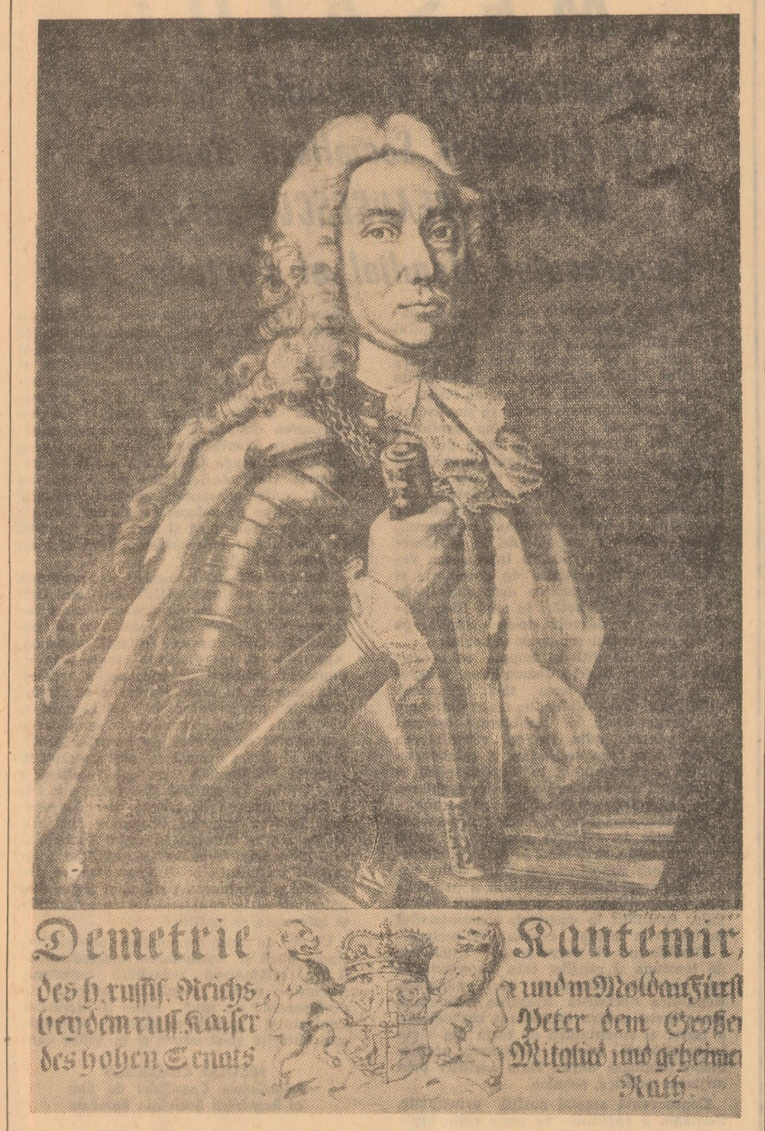
Demetrie Cantemir des h. russif. Dicks beydem russ. Kaiser des hohen Senais und in Moldau. Peter dem Großen Mitglied und geheime Rath

Lucrările fundamentale ale marelui cărturar român, cum ar fi „Descrierea Moldovei“, „Interpretarea naturală a monarhiilor“, „Istoria creșterii și descreșterii imperiului otoman“, „Istoria ieroglifică“ sau „Hronicul vechimii a romano-moldo-vlahilor“, constituie elemente importante, care-l recomandă pe Dimitrie Cantemir ca pe un istoric, adevărat cercetător al izvoarelor istorice și al documentelor, precum și un bun interpret al acestora.