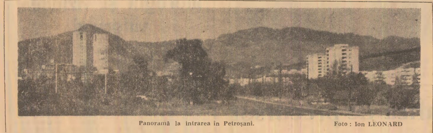
Panoramă la intrarea în Petroșani.