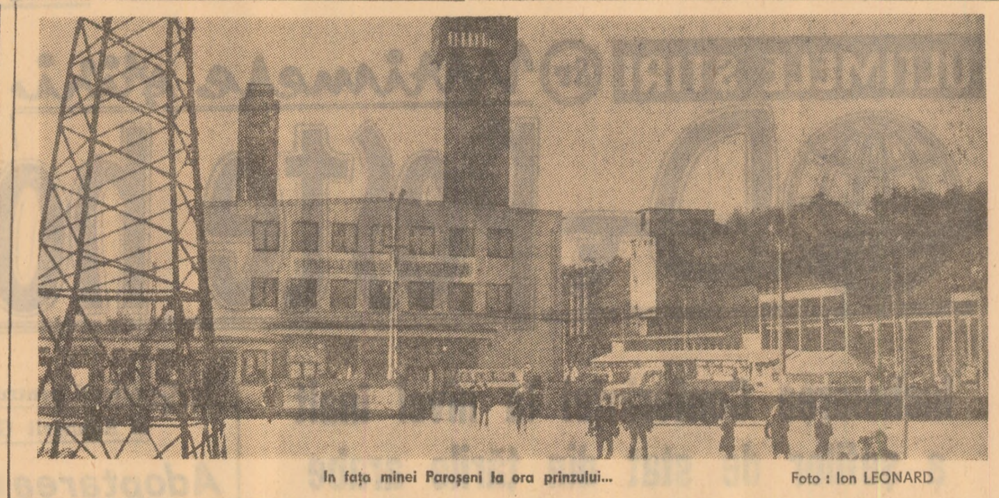
În fața minei Paroșani la ora prinzului...