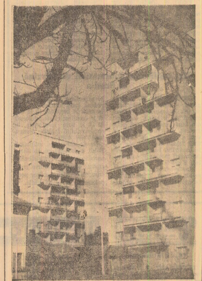
Balcoane sub ramuri desfrunzite... sau realități ale anotimpului hibernal.