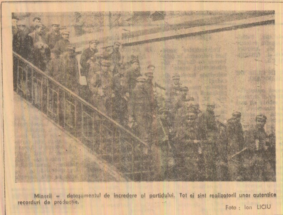
Minerii — detașamentul de încredere al partidului. Tot ei sînt realizatorii unor autentice recorduri de producție.