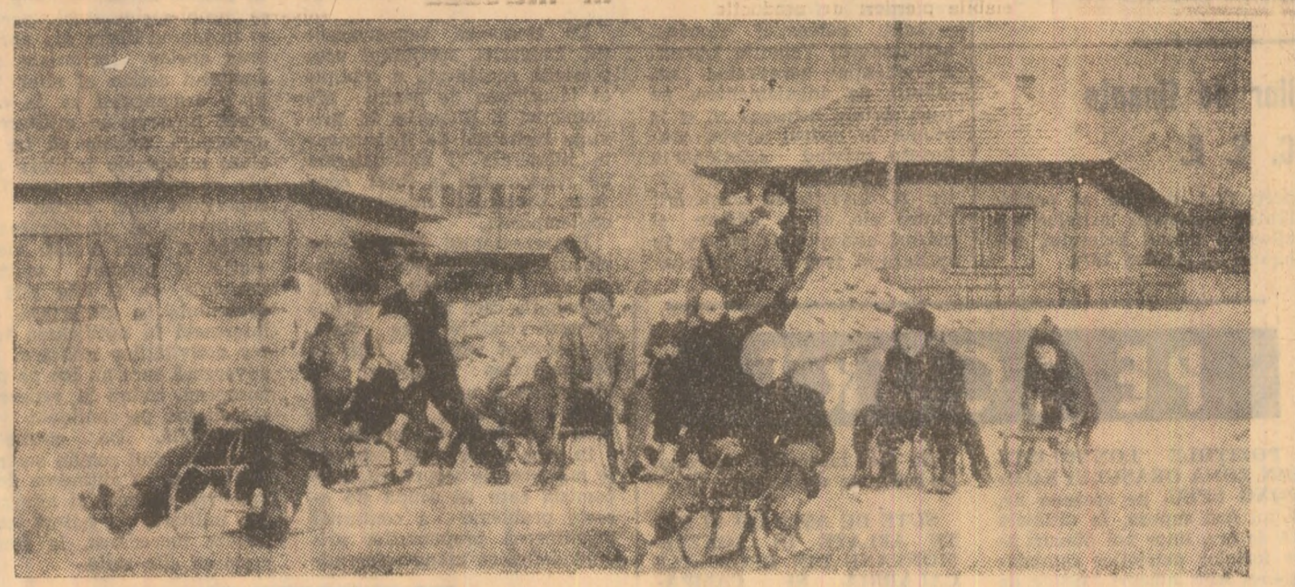
La Petroșani, copiii și-au găsit un loc de... dardeluș!