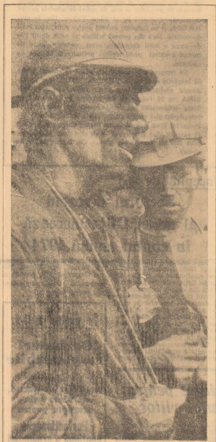
Recordurile minei Lupeni sint succese cărora comunistii le dau dimensiuni noi, de la o zi la alta. Ultima cifră — 7.755 tone de cărbune ilustrează pregnant potențialul acestui hornic colectiv.