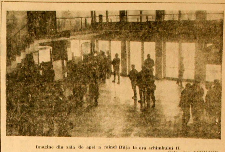
Imagine din sala de apel a minei Dița la ora schimbului II.