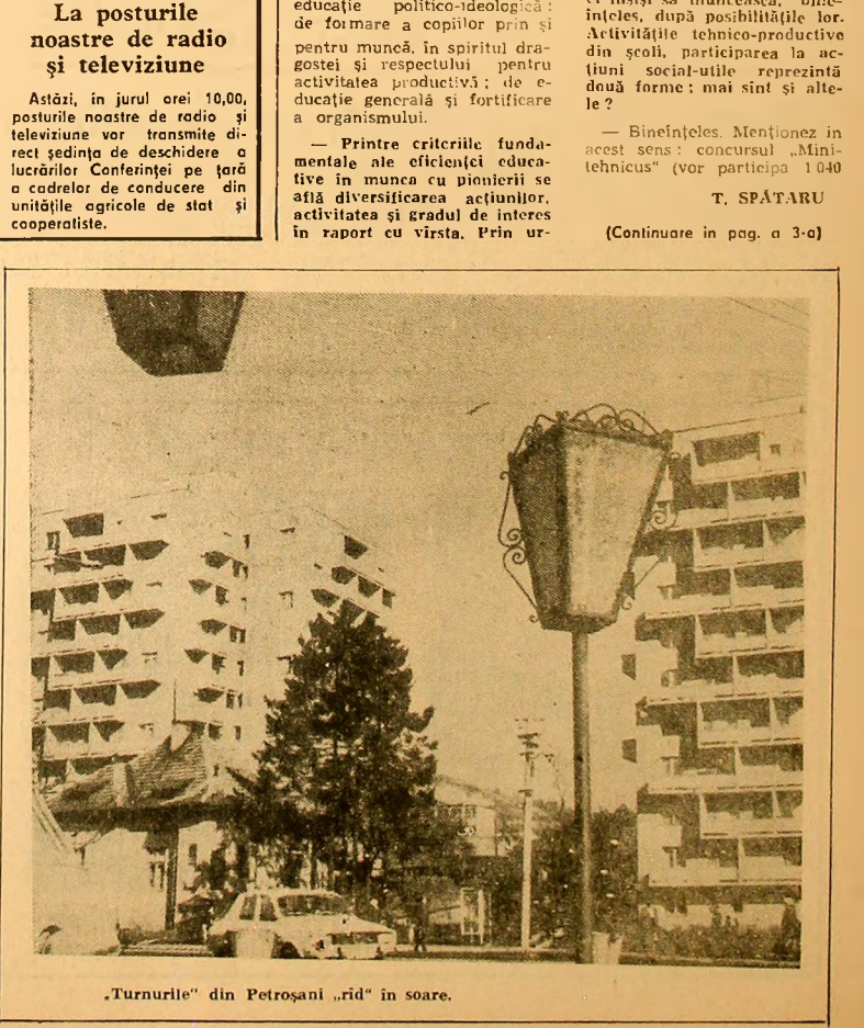
„Turnurile” din Petroșani „rid” în soare.

La posturile noastre de radio și televiziune Astăzi, în jurul orei 10,00, posturile noastre de radio și televiziune vor transmite direct ședința de deschidere a lucrărilor Conferinței pe țară a cadrelor de conducere din unitățile agricole de stat și cooperatiste. V. TEODORESCU (Continuare în pag. a 3-a)