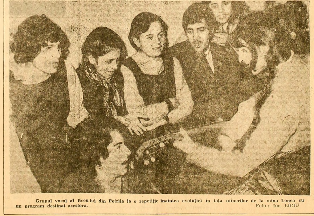
Grupul vocal al școlii din Petrița la o repetiție înainte evoluției în fața minerilor de la mina Lonea cu un program destinat acestora.