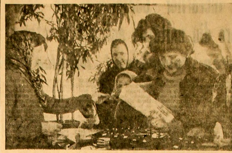
La chiocșul nr. 92 din cadrul complexului comercial din Petrița, aglomerație la... mărțișor. Se pare, însă, că pentru bărbaiți!

Succesele înregistrate în luna februarie, dar și deficiențele care mai persistă și care au fost analizate cu responsabilitate vor trebui să constituie un imbold pentru mineții Văii Jiului de a deslășuri în cursul lunii marie o activitate caracterizată prin indicatori tehnico-economici tot mai buni.