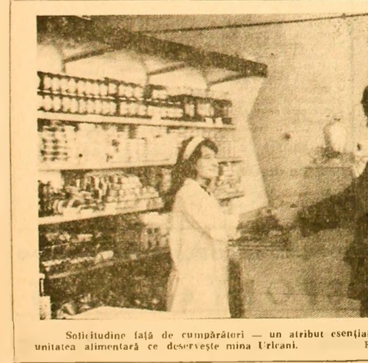
Solicitare față de cumpărători — un atribut esențial, întinut de fiecare dată la unitatea alimentară ce deservește mina Urleani.