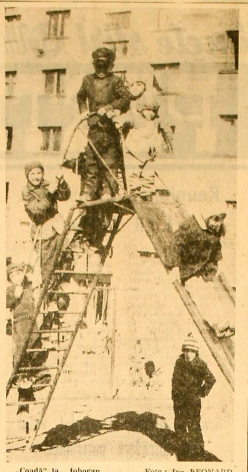
„Coadă” la...