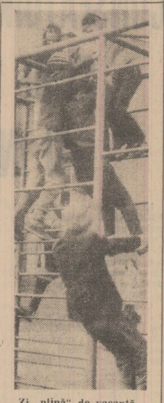
Zi „plină” de vacanță.

menținerea acordată de comisia județeană de urmărire și evidențiere a întrecerii patriotice pe anul 1973.