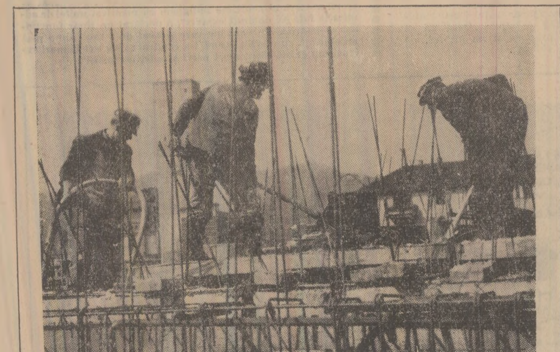
Betonistii din brigada condusă de Gheorghe Cimpeanu, surprinși în timpul turnării de betoane în stîlpii și grinziile noului bloc magazin în construcție la Aeroport — Petroșani.

Deși s-a apreciat că bilanțul de ansamblu al activității pe șantierul Văii Jiului a fost