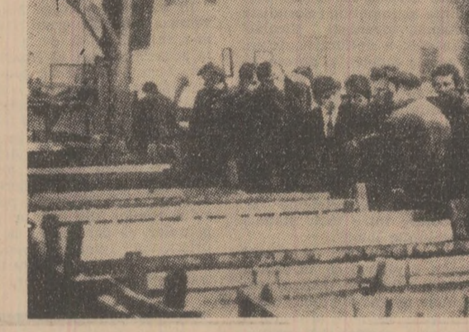
Studentii anului IV electro, secția utilaj minier, în timpul unei vizite de studiu la Fabrica de stilpi hidraulici Vulcan.