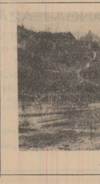
V. Sud, Pustiu, noroi și trei pomișori.

a arborilor tineri sînt cîteva exemple în care lipsa de responsabilitate a unor, ignoranța eforturilor ce au fost făcute pentru înălțarea fiecărui arbore al codrilor generațiilor viitoare risca să tulbure dezvoltarea tinerei plantații.