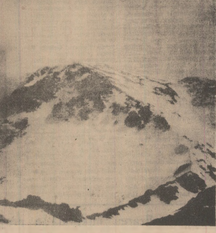
Peretele abrupt al Girjei, obstacol semeț în calea norilor.

molească minusculele schiari, precum și a veteranelor, care nu au pierdut nici în a-cest an ocazia de a se întrece într-un original concurs al schiștilor cu nea la timp, au avut da-