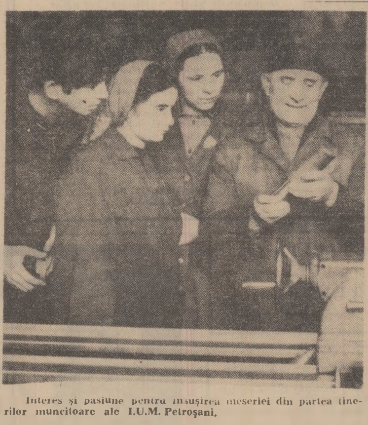
Interes și pasiune pentru însușirea meseriei din partea tinerilor muncitoare ale I.U.M. Petroșani.