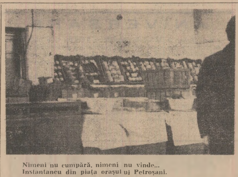
Nimeni nu cumpără, nimeni nu vinde... Instantaneu din piața orașului Petroșani.