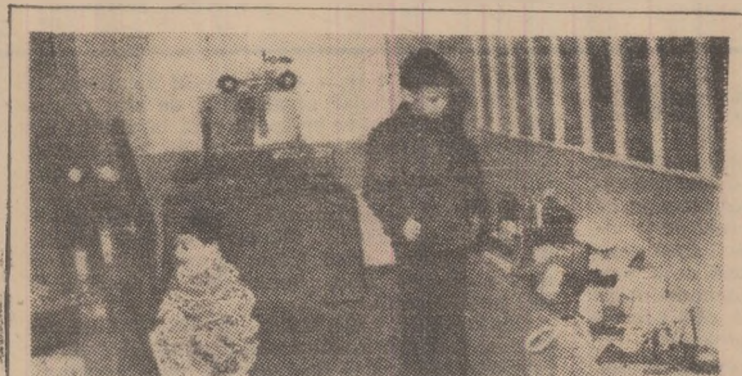
Aspect din expoziția de la Casa pionierilor din Petroșani.

Cu o bună bază tehnic-materială și cu o experiență prețioasă în educația copiilor în spiritul muncii, Casa pionierilor din Petroșani continuă efortul școlii de a forma pentru viața tinere generații.