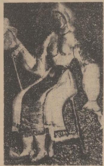
„Toreătoarea” — metaloplastie