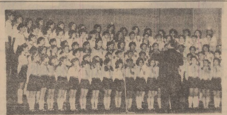
Corul „Doina” al pionierilor de la Școala generală nr. 5 Petrița.

Corul „Doina” a prilejuit și la cea de a V-a aniversare revelația unei plăcute audiții, cu variate selecțiuni, din cele peste 50 piese corale care au reconfirmat valoarea artistică a acestei tinere formații pionierești.