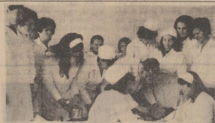
În timpul examenului de sfîrșit de an al cursurilor de surori de la Petrița.