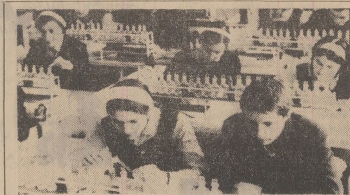
Oră de chimie în modernul laborator al Liceului Vulcan.