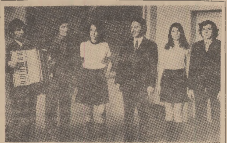
În sala de apel a minei Petrița evoluează în fața minerilor brigada artistică a clubului muncitoresc din Lonea.