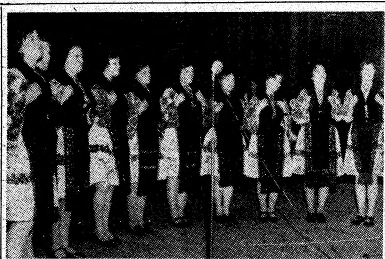
Evoluează în concurs grupul vocal al căminului cultural din Cîmpu lui Neag.

Deliberarea juriului a stabilit ferarhii valorice, dar nu acesta este lucrul cel mai important, confruntarea iubitorilor muzicii și dansurilor populare a creat premisa unui fructuos dialog al valorilor folclorului momirlănesc. Evidențind reușitele acestui concurs de angajare, avem însă în vedere și inadvertențele care acreditează un anume dezinteres față de producțiile folclorice, din fericire, ră-