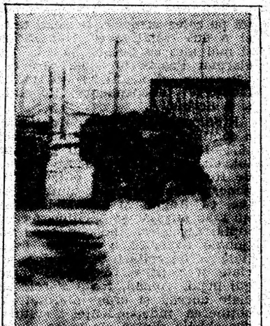
Cînd frînele și anvelopele nu „prind” sau dacă zgura era așternută la timp...

Ne-am edificat apoi de-a lungul șoselei între Iseroni și Vulcan. Incredible! Modul în care au inter-