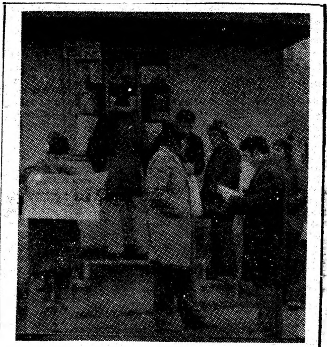
După ieșirea din șut minierii vulcăneni citesc cu interes presa zilei.

Mai este oare cazul să subliniem necesitatea și importanța curățeniei pentru sănătatea noastră, a tuturor? Aspectele pe care le-am întîlnit pe teren în cursul anchetei noastre și inserate mai sus pledează în favoarea unui răspuns afirmativ. E.G.C. și cetățenii trebuie să dovedim, deci, mai mult interes și respect față de această cerință și totodată condiție elementară a vieții, să onorăm cu mai multă grijă și răspundere această carte de vizită a orașului.