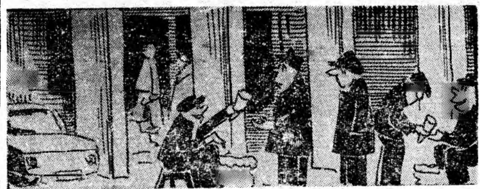
În fața cinematografului „7 Noiembrie” din Petroșani au apărut vînzători de semințe ambulante pe care nu-i stingherește nimeni.

Cu băltoace și nămoluri ce, precis or să creeze Lungi nemulțumiri, discuții, fel de fel de ipoteze... Pentru care T.C.H.-ul, de așteaptă primăvara Va primi la epitețe sinonime cu... ocară!! Ion LICIU