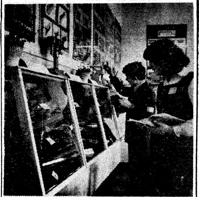
Instantaneu din cabinetul de tehnologie al Grupului școlar minier din Petroșani.