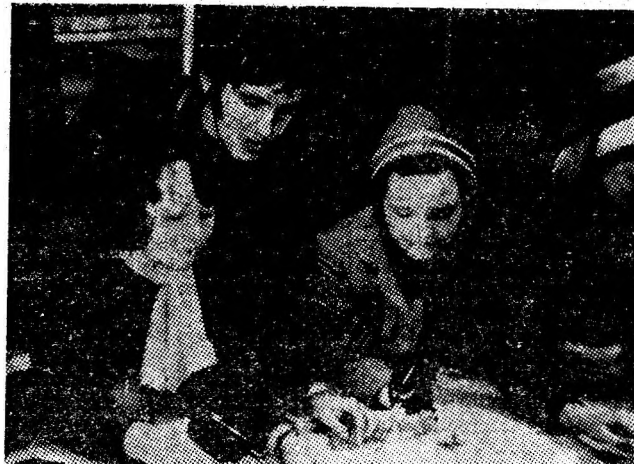
Școala generală nr. 4 Vulcan. În atelierul de electro-tehnică, elevii pregătesc materialul și aparatul necesar cabinetului de orientare școlară și profesională.