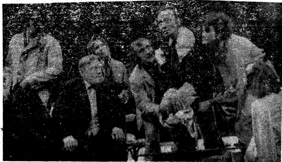
Un moment din spectacolul „O anecdotă provincială”, prezentat de actorii Teatrului de stat „Valea Jiului”.