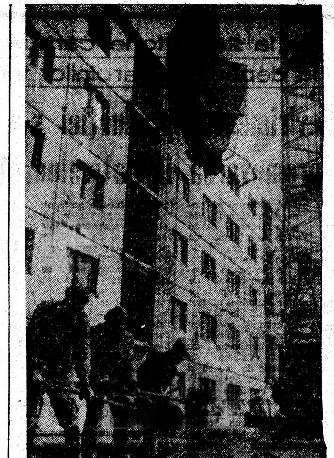
Se ridică în ritm rapid ultimul etaj al noului bloc de locuințe P-19 din cartierul Aeroport - Petroșani.