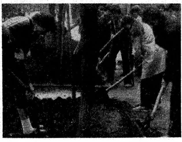
Elevii ai claselor a IX-a și a XI-a de la Grupul școlar minier Lupeni într-o acțiune de înfrumusețare a orașului în care trăiesc și învață.