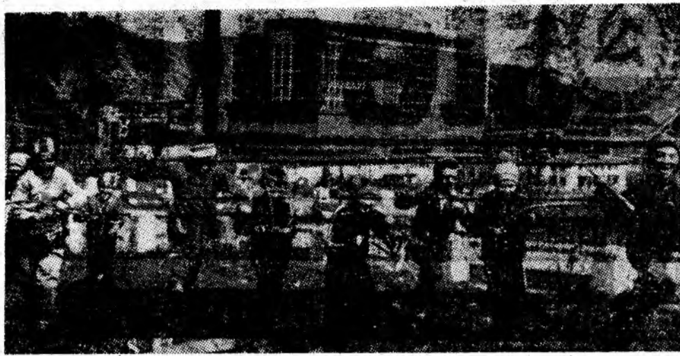
Vulcan. A sosit vacanța!

V. S. FENEȘANU, cu sprijinul biroului circulației al Miliției municipale Petroșani