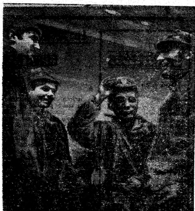
Cîțiva din cei zece bărbați de la Dilja, surprinși de reporter la ieșirea din șut.

Mulțumind, tovarășul Nicolae Ceaușescu și tovarășa Elena Ceaușescu au adresat cetățenilor orașului Washington un cald salut din partea poporului român, exprimînd aprecierea față de sentimentele de prietenie și ospitalitate cu care sînt înconjurați în aceste zile.