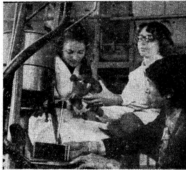
În laboratorul de preparare gravitațională, studenții la o lucrare practică de decantare.