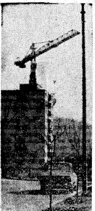
Noi construcții de locuințe.

O TRECERE ÎN REVISTA a formațiilor corale și a brigăzilor artistice din Lupeni are loc mîine, la clubul din localitate. Vor evolua, în fața publicului, corul bărbătesc al minei Lupeni, corul mixt al I.F.A. „Viscoza”, grupul vocal al Spitalului și cele 8 brigăzi artistice de amatori. Acțiunea se va încheia cu o seară cultural-distractivă pentru public și artiștii amatori. (I. M.)